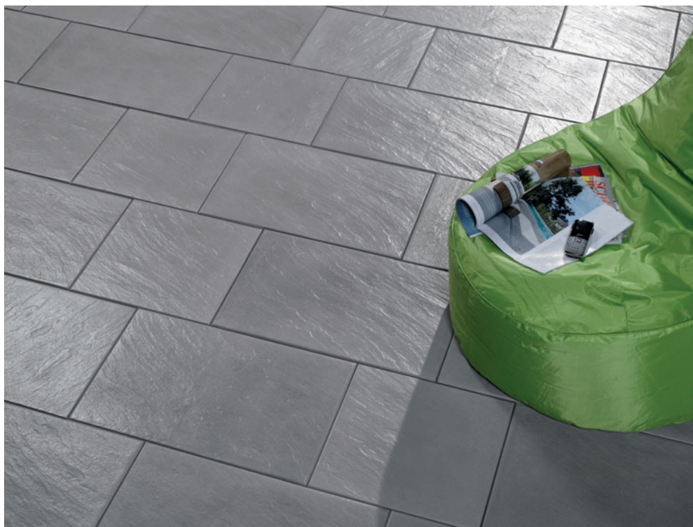
Рис. 1: Бетонные плиты с эстетичным дизайном для повседневного спроса пользуются растущим спросом (завод F.C. Nüdling)

«Отличительной особенностью всех матриц SR Schindler является их очень высокая точность размеров и длительный срок службы. Благодаря этим свойствам мы помогаем нашим клиентам выпускать бетонные плиты, кото-