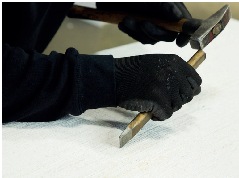
Рис. 3: Изготовление эскиза дизайна

рые также отвечают строжайшим требованиям с точки зрения внешнего вида и пригодности для повседневной эксплуатации», – отмечает Андреас Шлеммер, который работал в одной известной производственной компа-