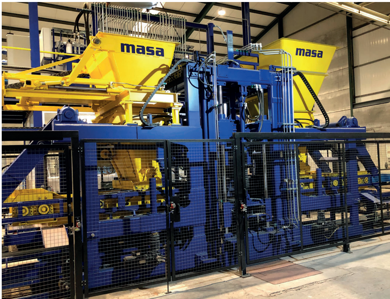
Вибропресс Masa L 9.1 для производства бетонных блоков с облицовочным слоем или без него

изготовителей. Машины Masa известны во всем мире своим высоким качеством и проверенным немецким ноу-хау и предлагают важные преимущества на всех этапах реализации проектов.