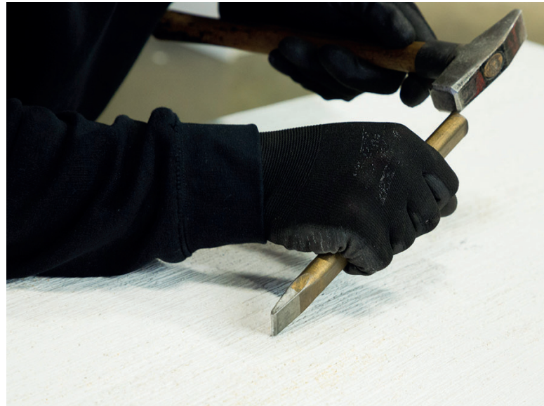
Abb. 3: Anfertigung eines Designentwurfs