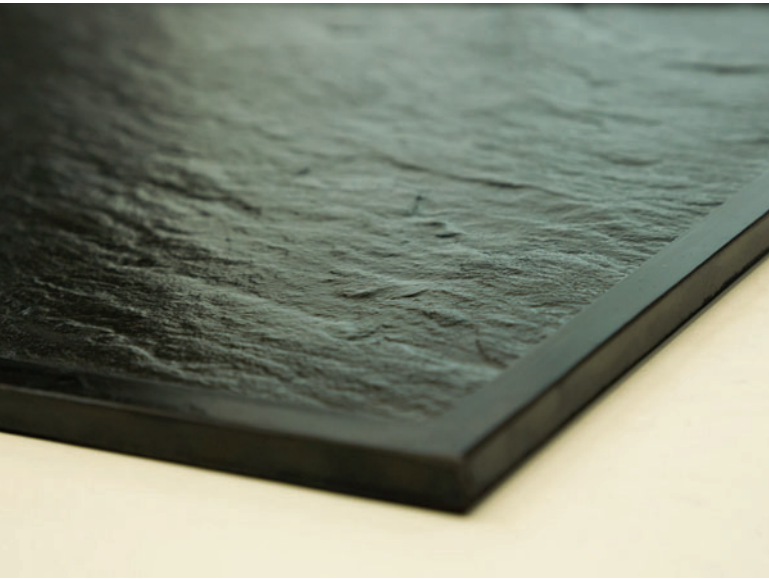
Abb. 2: Oberflächenstruktur einer Matrizze

platten herzustellen, die auch höchsten Ansprüchen an Optik und Alltagstauglichkeit gerecht werden“, berichtet Andreas Schlemmer, der mehr als 25 Jahre in einem namhaften Produktionsunternehmen in der Betonbranche tätig war und seit