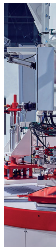
Компания SR-Schindler представила новый пресс типа UNI 1200 в 2019 году на выставке bauma в Мюнхене