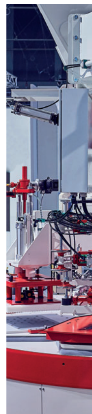
SR-Schindler presentó este año la nueva prensa del tipo UNI 1200 en la feria bauma de Múnich.