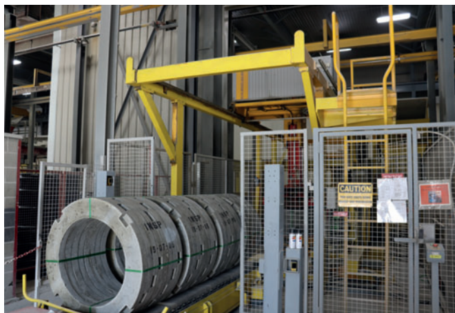
На протяжении многих лет в эксплуатации: установка Ringmaster компании Schlüsselbauer Technology