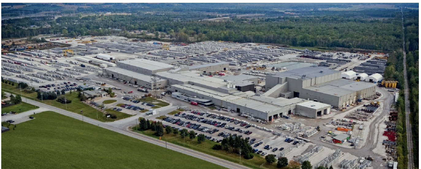
Территория завода Decast Ltd. В Утопии

Мостостроение является очень важной областью деятельности для компании Decast. Компания производит мостовые балки длиной до 50 м, а также модульные мостовые системы. Преимущества оперативных сроков строительства с использованием сборных ж/б элементов бес-