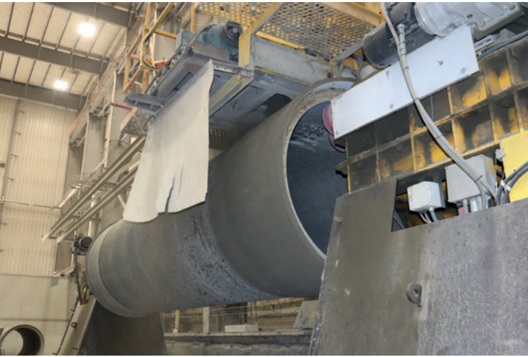
Установка для нанесения покрытия наносит защитный слой из бетонного раствора на натяжную арматуру

ности составило определенные трудности, проблема была решена очень оперативно, и поэтому в настоящее время практически все изготовленные стальные цилиндры успешно проходят испытание на герметичность.