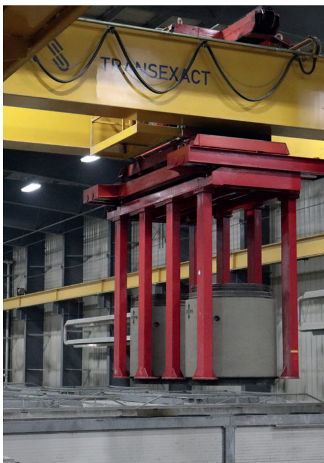
Также на заводе успешно функционирует линия по выпуску труб и элементов люков Schlüsselbauer Exact

После прокладки натяжной арматуры по всей длине трубы проволока надежно фиксируется специальным зажимом на конце трубы.