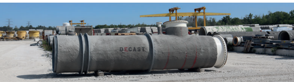
С 2003 года компания Decast также выпускает бетонные напорные трубы для сетей питьевого водоснабжения