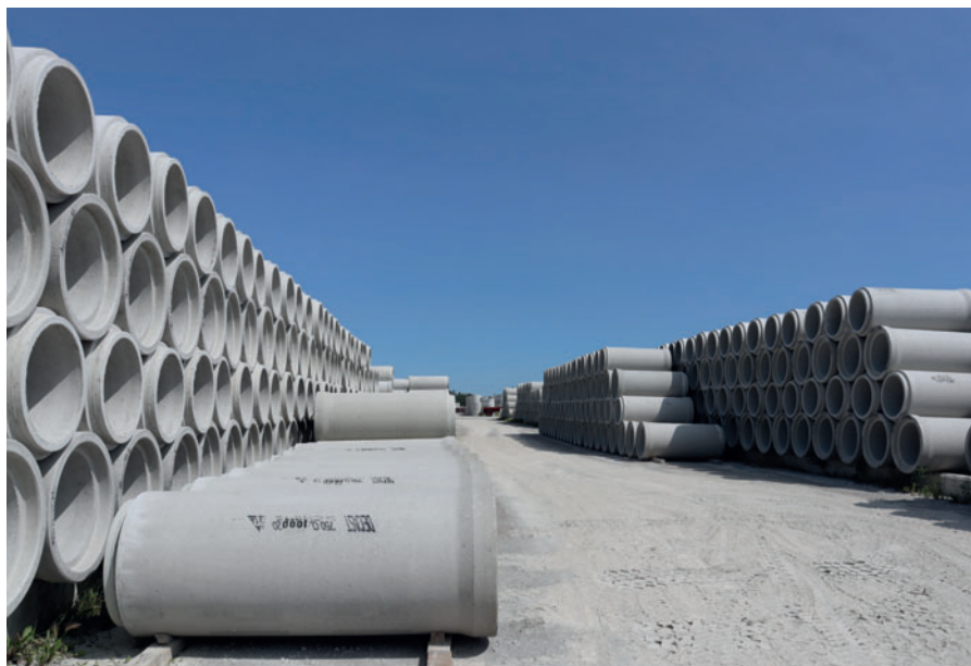
Склад под открытым небом компании Decast

спорны, что означает, что этот метод строительства приобретает все большее значение и востребованность для Decast. Кроме того, в дополнение к сборным ЖБИ для отвода сточных вод и дождевой воды, Decast также выпускает множество специальных сборных ж/б элементов, таких как несущие стены.