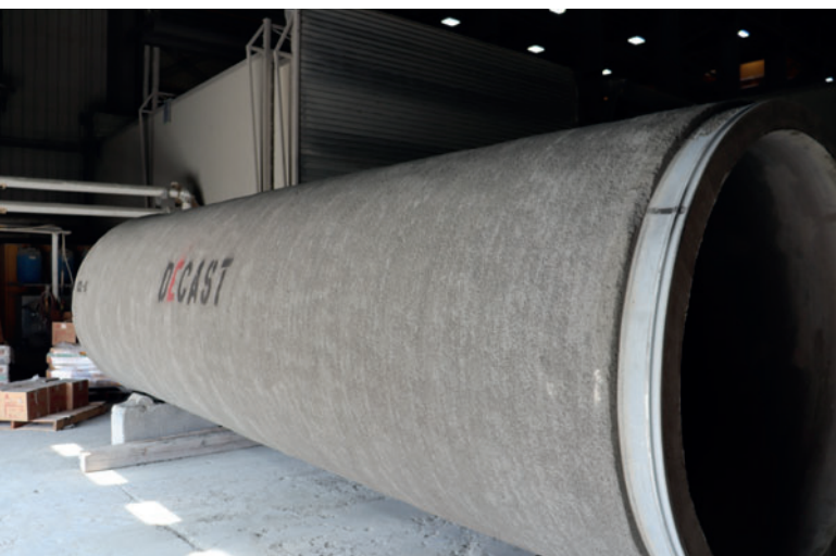
Готовая водонапорная труба на станции ОТК

На следующем этапе погрузочно-разгрузочное оборудование Schlüsselbauer используется для кантования стальных цилиндров из горизонтального положения в вертикальное и укладки в пресс-форму для труб установки с роликовой головкой фирмы Besser. Эта установка формирует бетонную облицовку для напорной трубы, по существу, бетонную трубу в стальном цилиндре. Этот цилиндр является внешней оболочкой в производстве труб. В результате получается двухкомпонентная труба, содержащая внешний стальной корпус и бетонный сердечник. Затем свежесформованные трубы выдерживаются в печи IFS не менее 12 часов для затвердевания в соответ-