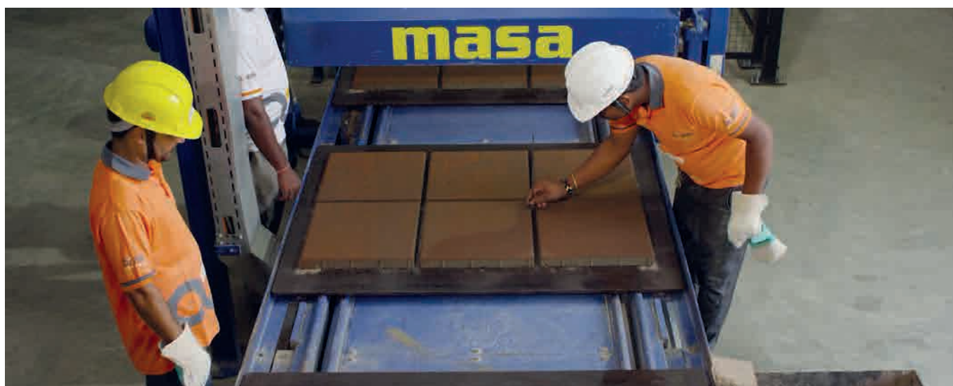
Ручной контроль качества свежеотформованных бетонных плит