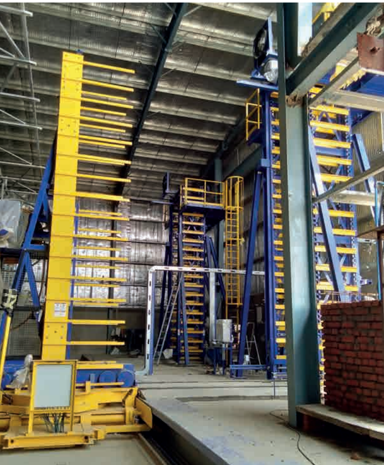
Монтаж подъемно-опускного штабелера и вилочного погрузчика