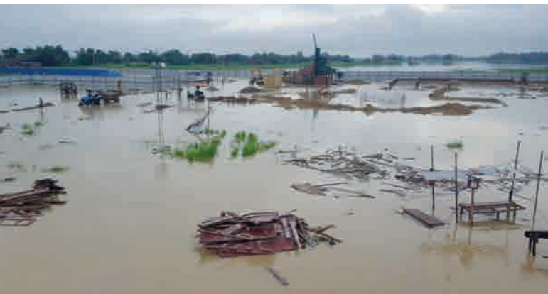
Затопление территории после сильных муссонных ливней

Кроме того, благодаря тесным связям с деловыми кругами, основатели компании обладают глубокими знаниями и большим опытом в сфере как производства, так и сбыта стройматериалов. С учетом общей логистической концепции было решено разместить новую линию Masa L 9.1, оснащенную БСУ Masa, на заводе в Навалпараси, штат Рамграм. Место расположено недалеко от исторического города Лумбини (культурное наследие ЮНЕСКО), где родился основатель буддизма Сиддхартха Гаутама.