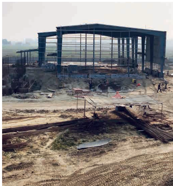
Строительство нового завода в Навалпараси, Рамграм