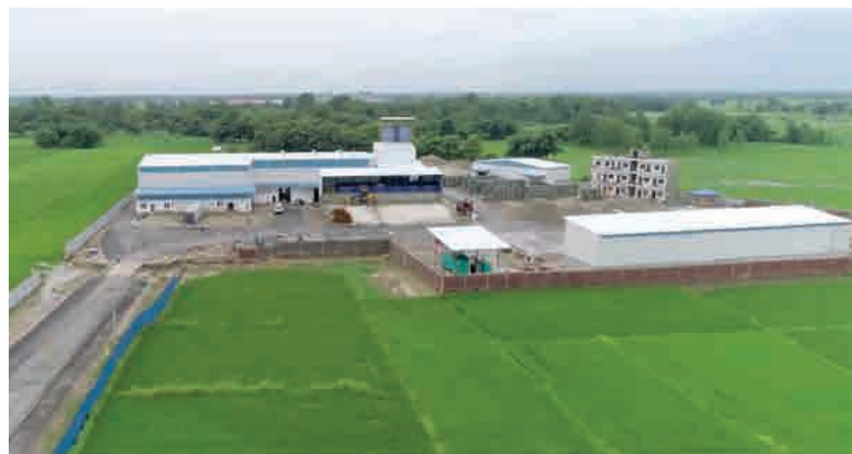
С июня 2018 года в Рамграме выпускаются высококачественные бетонные блоки

При планировании линии вибропрессования был использован проверенный модульный принцип Masa. Надежные стандартизированные компоненты, в сочетании с управляющим программным обеспечением Masa, дали результаты, превосходящие все ожидания.