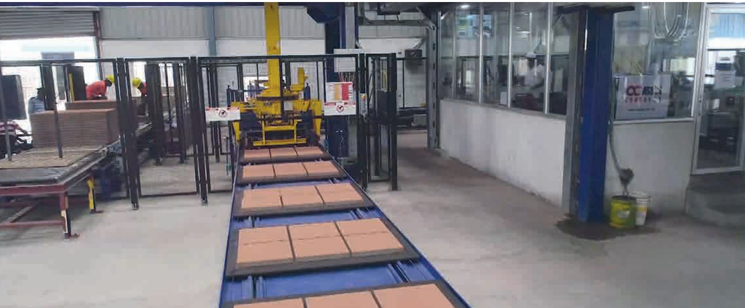
Станция кубирования Masa

1400 x 1100 мм. И без того обширная базовая комплектация Masa L 9.1 была дополнена пакетом автоматической смены форм и встроенной функцией ограничения высоты для производства высокоточных изделий. Транспортировка свежееотформованных блоков в зону выдержки осуществляется с помощью надежного стандартного балочного транспортера Masa, подъемника и вилочного погрузчика (грузоподъемность 10 т высотой 16 ярусов при высоте яруса 400 мм).