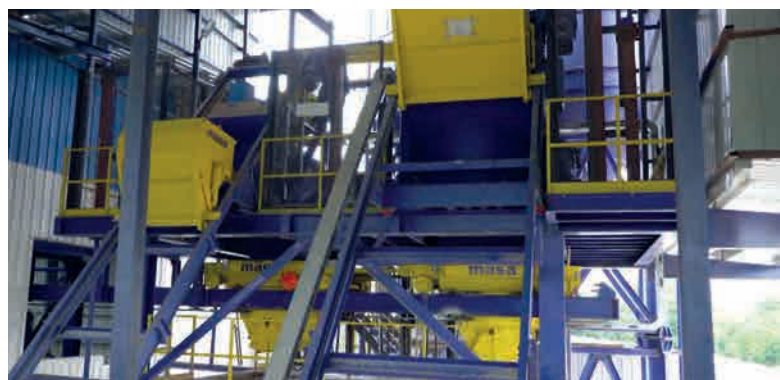
Скиповые подъемники для подачи заполнителей в БСУ Masa