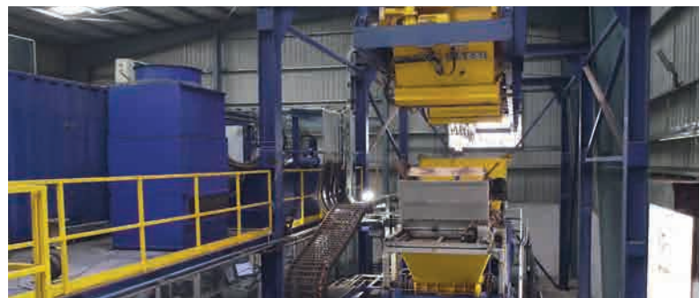
Доставка бетонной смеси на вибропресс с помощью адресной линии подачи

БСУ Masa оснащена смесителями для опорного и облицовочного бетона PH 1500/2250 и PH 500/750, весами периодического действия на 6000 кг, двумя весами для цемента, дозатором воды Aquados, четырехсекционным дозатором пигментов Masa, линией адресной подачи бетонной смеси со сдвоенной вагонеткой, а также другими надежными комплектующими и оборудованием для приготовления гомогенной бетонной смеси. Вибропресс Masa L 9.1 с частотно-управляемой системой вибрации рассчитан на работу с технологическими поддонами размером