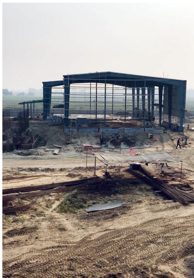
Sorge il nuovo stabilimento di produzione a Nawalparasi, Ramgram