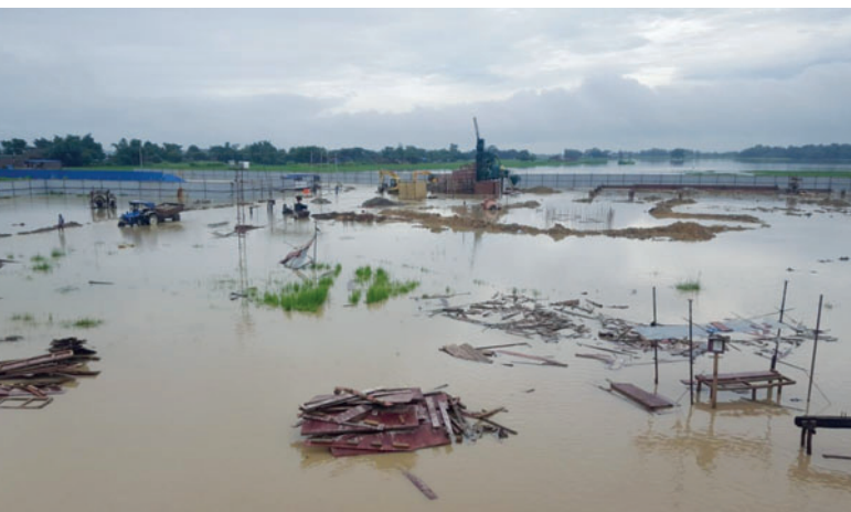
Inondazione del terreno dopo la violenta pioggia monsonica

Fin dall'inizio, Masa è stato tra i favoriti come possibile partner commerciale. Le visite allo stabilimento degli impianti Masa presenti nella vicina India nonché la visita allo stabilimento Masa di Andernach convinsero in via definitiva. Nel corso delle trattative emerse ben presto che, sulla base di intense ricerche precedenti condotte in India, occorreva introdurre in Nepal concetti di abbellimento, provenienti da Dubai, il Medio Oriente e l'Europa, contenenti idee molto precise sul portafoglio futuro dei prodotti "Next Generation".