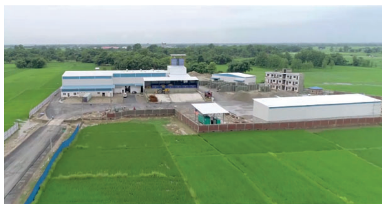
Dal giugno 2018, a Ramgram si producono blocchi in calcestruzzo di gran pregio

Nell'ottobre del 2016, Masa ed Asian Concrete siglarono la collaborazione. Mentre il progetto attraversava le fasi effettive di progettazione e produzione rapidamente e in assenza di complicazioni, le questioni relative al finanziamento e all'autorizzazione si configurarono in parte come molto difficili, cosa tuttavia tipica per il paese Nepal. A causa della "stagione dei venti" (Ritu Hawa), Asian Concrete dovette accettare un ulteriore ritardo di diversi mesi: Una violenta pioggia monsonica inondò il nuovo stabilimento prima che il nuovo capannone di produzione potesse essere eretto a ca. 1 m di altezza dal normale livello del terreno per poter essere preparato proprio contro tali inondazioni.