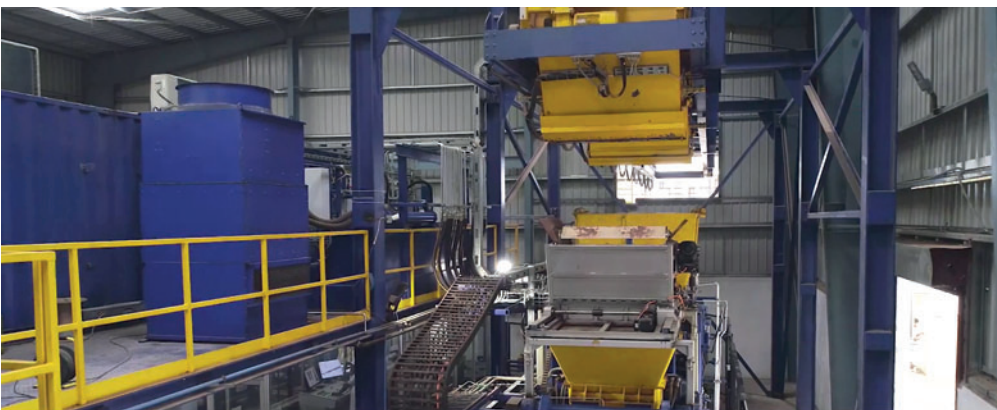
Trasporto del calcestruzzo tramite vagonetto alla blocchiera

La blocchiera Masa L 9.1 con vibrazione a regolazione di frequenza è concepita per un pallet di produzione di dimensione 1.400 x 1.100 mm. La dotazione di base, comunque già ampia della macchina Masa L 9.1, è stata integrata tra l'altro con l'aggiunta di un pacchetto cambia-stampo automatico e l'integrazione di una funzione di limitazione dell'altezza per la produzione precisa in altezza.