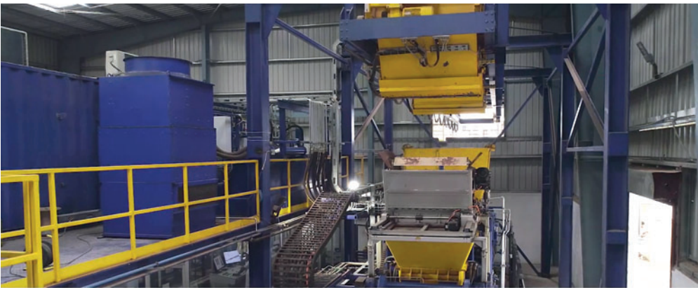
Transport du béton par convoyeur à benne jusqu'à la machine de production de blocs en béton

pour une taille de planches de support de 1 400 x 1 100 mm. L'équipement de base déjà très complet de la Masa L 9.1 a été renforcé par un dispositif automatique de changement de moule et l'intégration d'une fonction de limiteur de hauteur garantissant une fabrication précise.