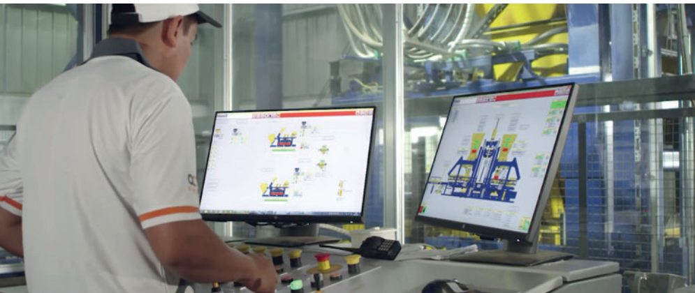
Surveillance de la production

Les blocs fraîchement produits sont acheminés jusqu'à l'espace de durcissement par des composants standard éprouvés de Masa comme par ex. un convoyeur à course libre, un ascenseur et un chariot transbordeur (capacité de charge de 10 t pour 16 étages et une hauteur d'étage de 400 mm).