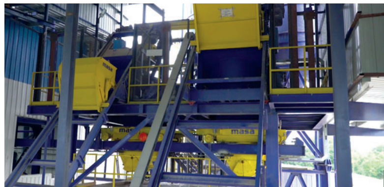
Ascenseurs de granulats pour malaxeurs à béton Masa

juin 2018 a confirmé la pertinence de ces efforts. Depuis, la société fabrique des dalles de béton, des bordures et des pavés avec ou sans surfaces multicolores de la plus haute qualité dans la ville de Ramgram.