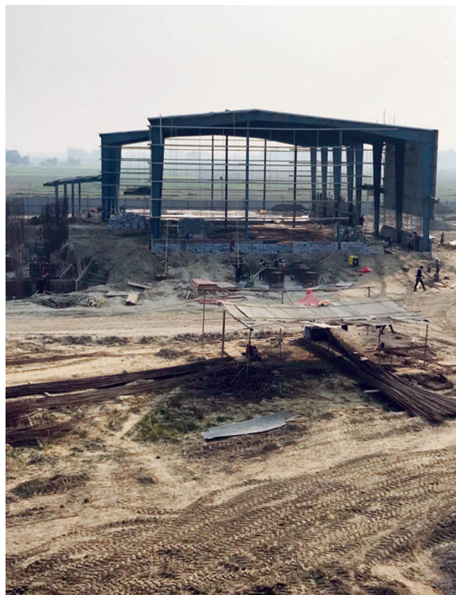
Le nouveau centre de production dans le district de Nawalparasi (Ramgram)