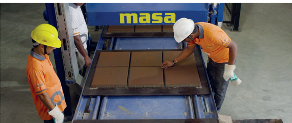
Contrôle manuel de la qualité des dalles de béton fraîchement produites