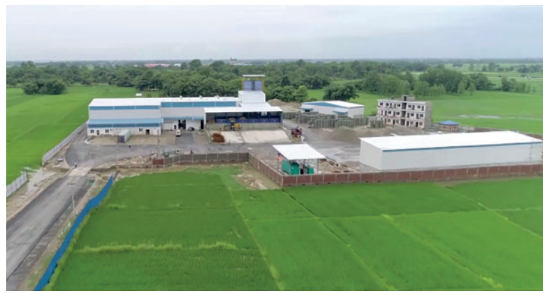
Des blocs de béton de haute qualité sont produits à Ramgram depuis juin 2018

Malgré toutes les difficultés, les décideurs d'Asian Concreto ont toujours poursuivi un objectif bien concret et ont fait montre de persévérance dans la mise en œuvre du calendrier fixé. La mise en service de l'installation de production de blocs en