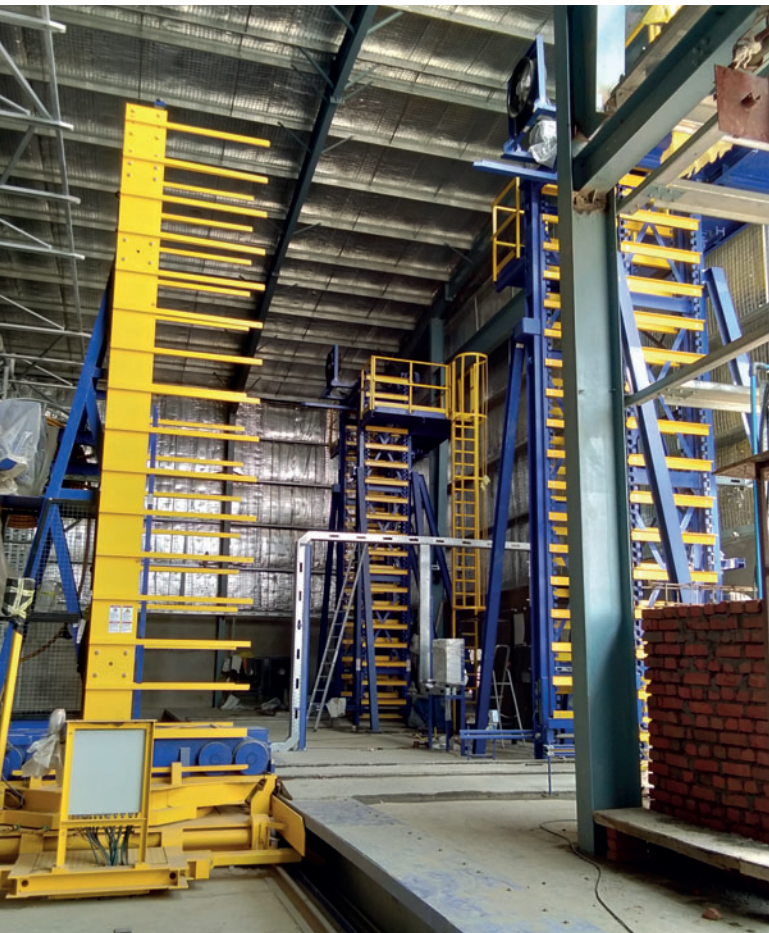
Montage de l'ascenseur/du descenseur et du chariot transbordeur

L'emplacement de la nouvelle installation Masa L 9.1 dotée d'un poste de dosage et d'une installation de mélange Masa, dans le district de Nawalparasi (Ramgram). Le site n'est pas loin de la ville historique de Lumbini (patrimoine mondial de l'UNESCO), lieu de naissance du créateur du bouddhisme Siddhartha Gautama.