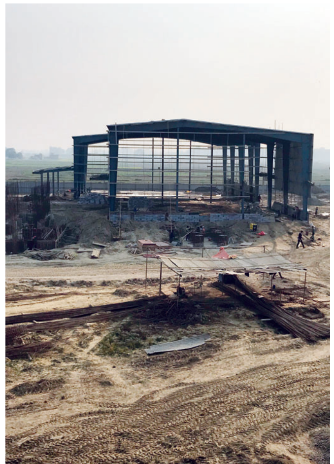
Die neue Produktionsstätte in Nawalparasi, Ramgramm, entsteht.