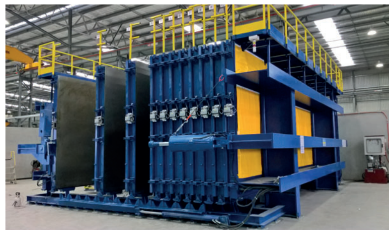
В 2018 году кассетная опалубка теспосом была смонтирована на заводе BGC, который стал первым предприятием в Западной Австралии, эксплуатирующим оборудование подобного рода