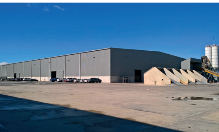
Компания BGC Precast выпускает высококачественные стеновые панели в соответствии с требованиями клиента на своей современной фабрике в Куинане