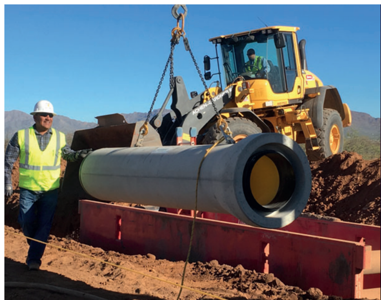
Укладка Perfect Pipe в округе Пима в штате Аризона в 2017 году