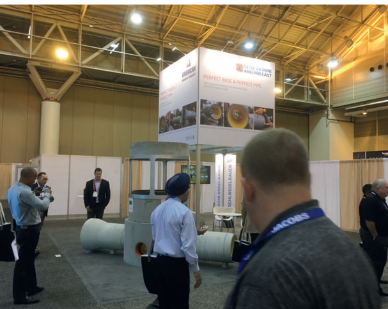
Демонстрация трубы Perfect Pipe на выставке Weftec 2018: впервые труба Perfect Pipe была показана на совместном стенде компаний American, Geneva и Schlüsselbauer на крупнейшей национальной инфраструктурной выставке