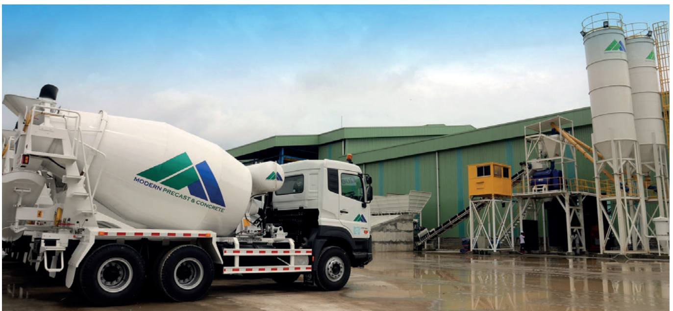
Die neue Mischanlage hat eine Kapazität von 500 m 3 pro Schicht. Modern Precast hat derzeit sechs Fahrmischer mit je 7 m 3 im Einsatz.

Auch für den Aufbau eines erfolgreichen Transportbetonwerks ist der Grundstein gelegt: Im Umkreis von ca. 50 km beliefert bereits eine kleine Flotte von derzeit sechs Fahrmischern eigene Projekte sowie externe Kunden. Die neue Mischanlage, ebenfalls made in Germany, vom renommierten Mischerhersteller BHS-Sonthofen in Zusammenarbeit mit dem lokalen Partner PT Detede, erreicht eine Produktionska-