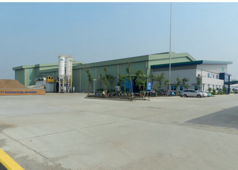
Kürzlich eröffnete PT Modern Panel Indonesia sein erstes Betonfertigteilwerk im neuen Industriegebiet von Cinkande, Banten.

In dem neuen Betonfertigteilwerk, das in einer ersten Phase für eine Gesamtkapazität von ca. 200.000 m 2 pro Jahr ausgelegt ist, soll ein weites Spektrum an Betonfertigteilen sowohl für eigene Projekte als auch für den freien Markt gefertigt wer-