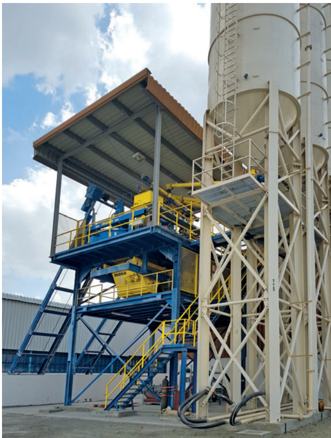
БСУ, состоящая из бетономесителей Masa PH 2000/3000 и PH 500/750