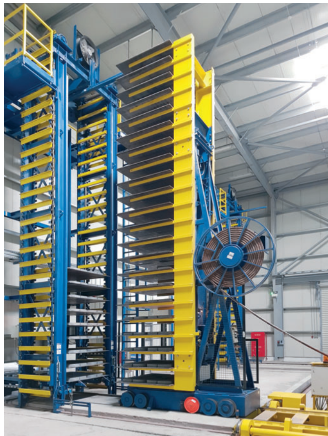
Вилочный штабелер Masa в зоне выдержки

Поставленная компанией Masa комплектная бетоноформовочная линия позволяет оптимальным образом удовлетворить тщательно очерченные требования клиентов: испытанные смесители для опорной и облицовочной бетонной смеси PH 2000/3000 и PH 500/750, загрузочные весы, весы для цемента, дозатор воды, дозатор пигмента, линия адресной подачи бетонной смеси с двойной вагонеткой и другие высококачественные комплектующие Masa служат основой для производства бетонной смеси стабильно высокого качества. Бетоноформовочная машина Masa XL 9.2, формующая на поддонах 1400 x 1300