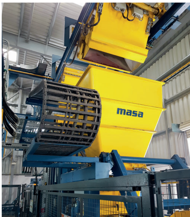
Бетонная смесь транспортируется из БСУ в машину для производства бетонных блоков Masa XL с помощью линии адресной подачи с двойной вагонеткой

Для достижения этой цели Али Аль-Барвани провел тщательный анализ и отбор производителей бетоноформовочных линий. Из множества различных предложений своим профессиональным и компетентным подходом выделялось предложение немецкого машиностроителя