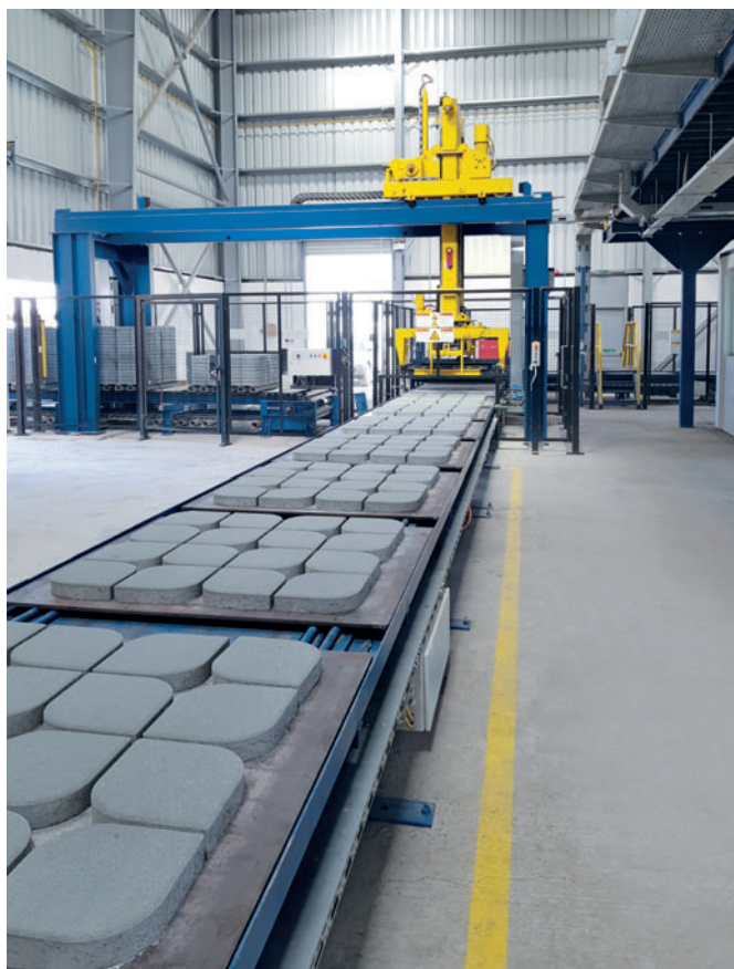
Затвердевшие изделия транспортируются к станции кубирования Masa с помощью балочного конвейера

ного штабелера и балочного конвейера. Современная энергоэффективная технология пакетирования служит для подготовки бетонных блоков для отгрузки на грузовики собственного автопарка компании Al Madina. Контур замыкается с помощью поперечного транспортера с подключенной щеткой для очистки, скребком и кантовательным устройством, в результате чего пустые производственные поддоны вновь возвращаются на бетоноформовочную машину.