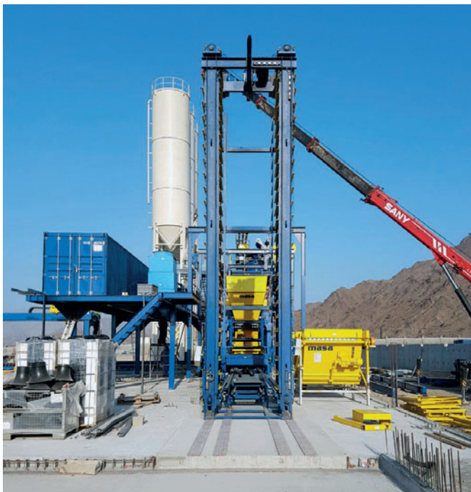
Новая линия производства бетонных блоков во время сборки: основные компоненты уже готовы к работе