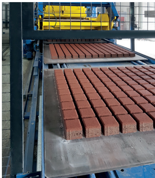
Свежеотформованные изделия – на технологическом поддоне размером 1400 x 1300 мм