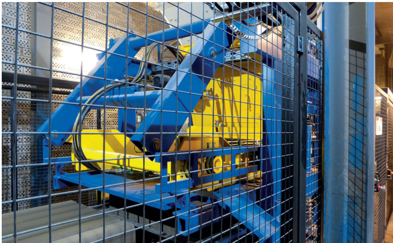
Компания Masa интегрировала вибропресс Masa L 9.1 в существующую производственную линию в Элькслебене