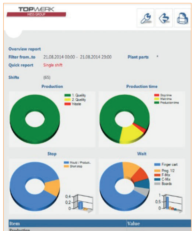
Analisi della valutazione