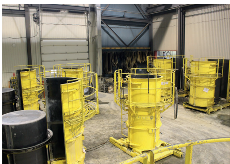
Формоустановка для производства бетонных колец с днищем Perfect