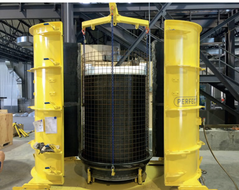
Подготовленная форма с арматурой стенки кольца и ...

Для изготовления негатива водовода достаточно одного работника. Он укладывает базовые пенополистироловые элементы на станцию резки и затем собирает негативный вкладыш из отдельных элементов.