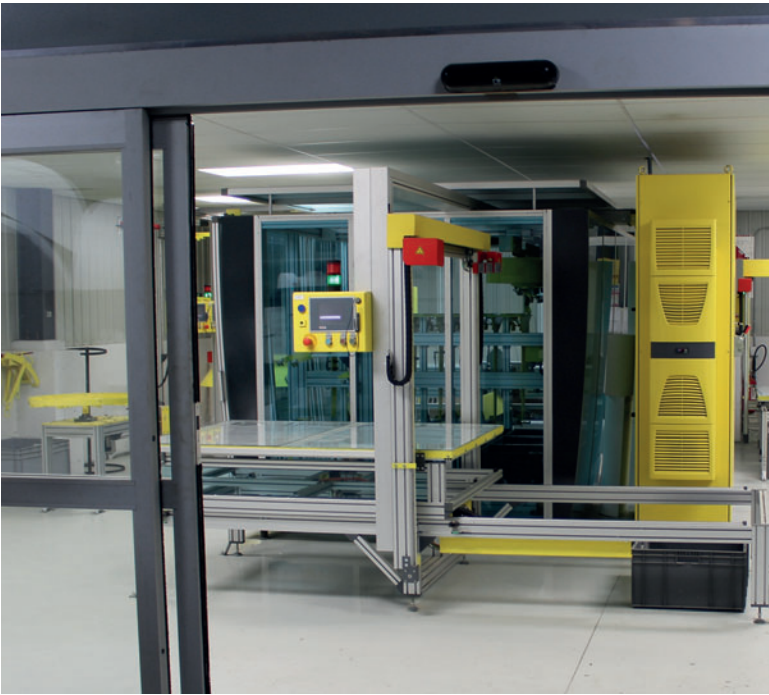
Центральный узел производственной линии Perfect: станция резки с резаками, работающими в двух и трех плоскостях

несли большую пользу, поскольку монолитные кольца изготавливаются исключительно из СУБ.