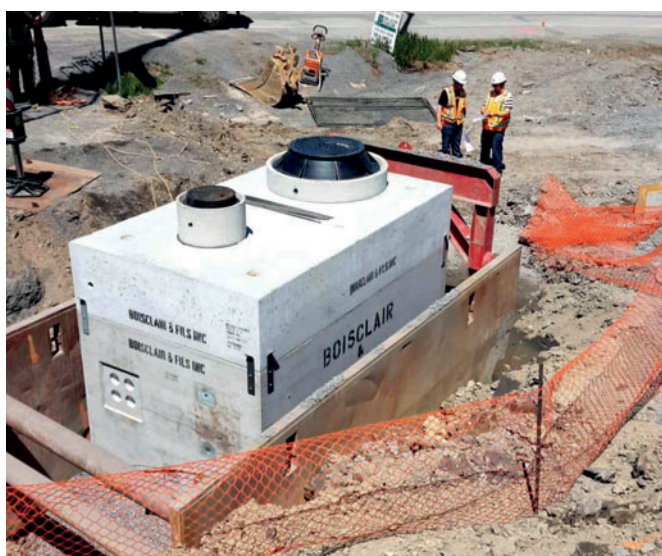
Фирма Boisclair et Fils специализируется на производстве ЖБИ для инфраструктурных проектов, а также для канализационных и сточных сетей, электро- и телекоммуникаций

Опыт в области производств вибролитевых изделий пригодился два года назад, когда компания начала активно внедрять самоуплотняющийся бетон (СУБ). Это был подготовительный этап перед запуском производства бетонных колец с днищем Perfect, и полученные знания при-