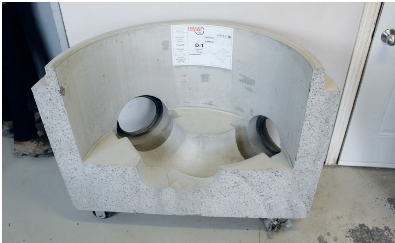
Элемент колодца Perfect в разрезе во время промотура

После этого необходимо извлечь негатив водовода. Это выполняется вручную силами одного работника. Благодаря специальному инструменту и инструктажу специалистов Schlüsselbauer эта процедура не отнимает много времени и сил.