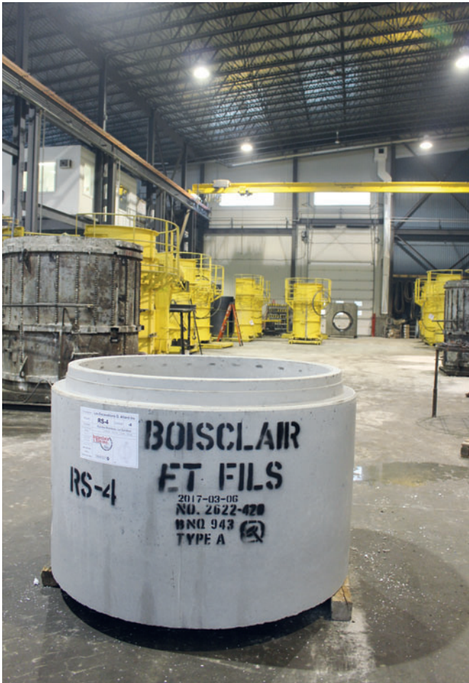
Готовое бетонное кольцо с дном Perfect перед отгрузкой на склад под открытым небом

Для контроля точного позиционирования отдельных частей используется лазер, расположенный над рабочим столом, который проецирует все соединения труб на поверхность стола.