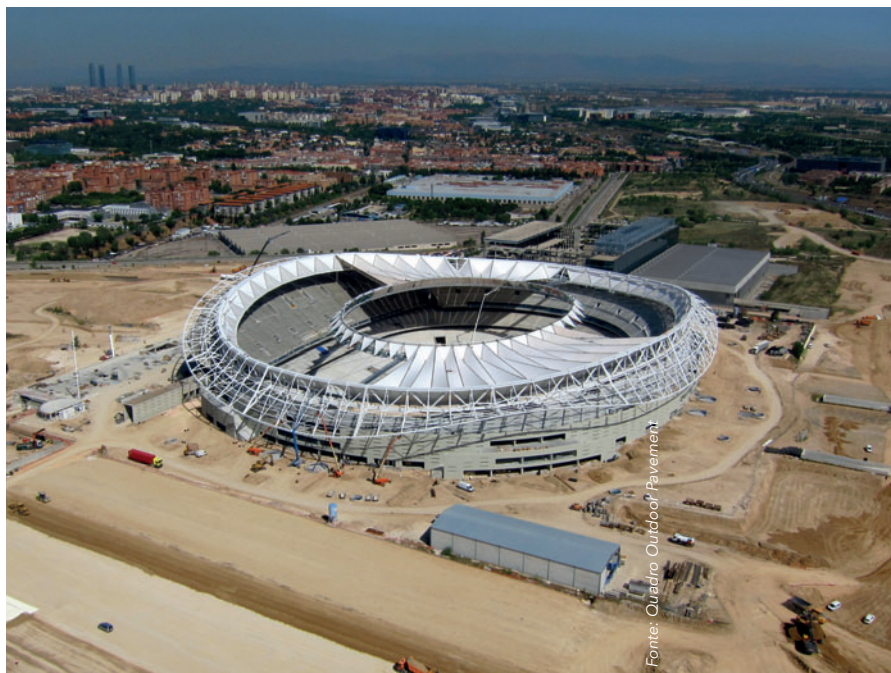
Stadio Wanda Metropolitano - Ripresa aerea

binazione di formati differenti in una posa mista, ha quindi un effetto molto moderno e dinamico. Inoltre, i prodotti impiegati dispongono della protezione anti-spostamento, "Fit-Block", autobloccante, utilizzata da Quadro in proprio per il progetto, e hanno conseguito ottimi valori nel comportamento d'infiltrazione. Ciò consente di raggiungere gli standard elevati dei SUDS (Sistemas urbanos de Drenaje Sostenible) - i sistemi di drenaggio urbano sostenibile -, considerati una premessa per configurare l'intera area esterna dello stadio.