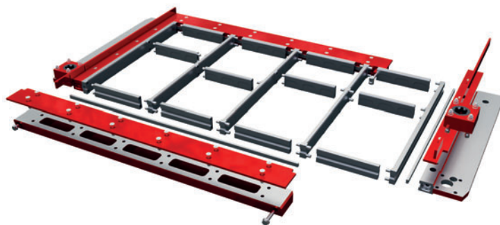
Vista esplosa di una parte inferiore dello stampo Boltline3™

L'utilizzo continuo dello stampo per blocchi di calcestruzzo genera, come in ogni utensile, usura, alla quale ci si oppone con l'alto grado di durezza descritto sopra e il preciso adattamento tra parte superiore e parte inferiore dello stampo. Ma diversi altri fattori di influenza, come per es. le impostazioni