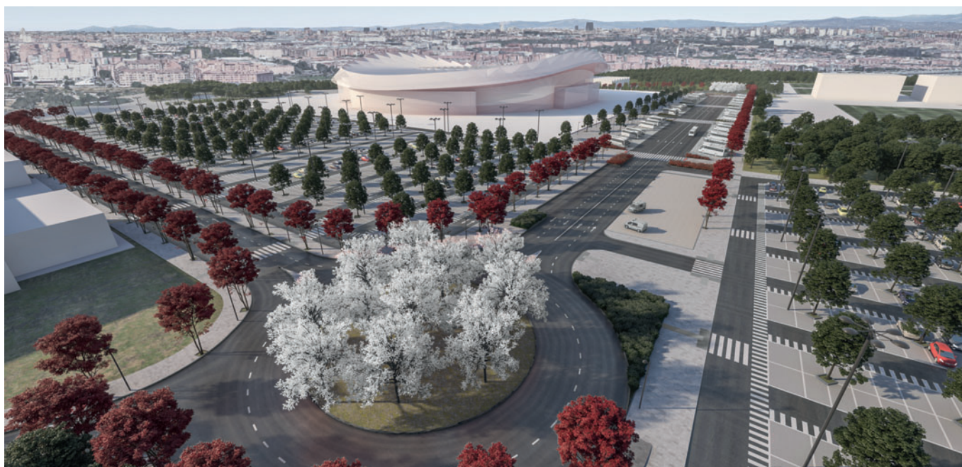
Stadio Wanda Metropolitano - Rendering

La geometria relativamente semplice dei blocchi rettangolari, utilizzati soprattutto per motivi pratici, alleggerita dalla com-