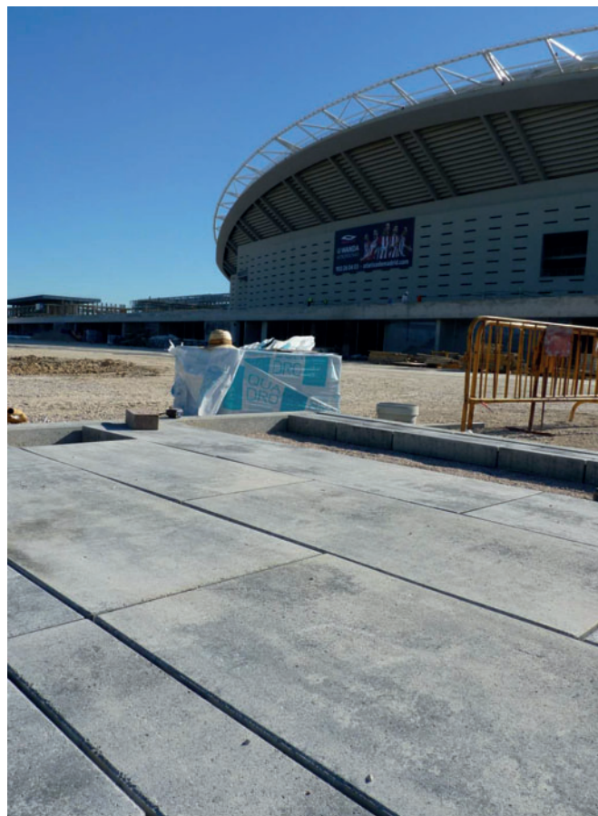
Posa dei blocchi in calcestruzzo utilizzati nell'ambiente esterno - Fotografia