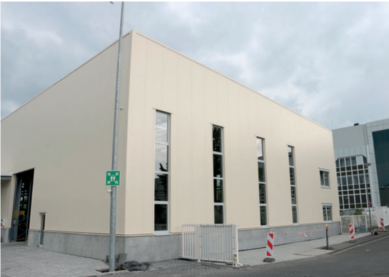
Es ist vollbracht: Die neue Ersatzteilversandhalle in Andernach ist seit dem 28. April nun offiziell in Betrieb.

Mit dem symbolischen Durchschneiden des roten Sperrbandes wurde am 28. April 2017 die neue Ersatzteilversandhalle nun auch offiziell in Betrieb genommen. Während einer kleinen Feierstunde stand der Gebäudekomplex allen Masa-Mitarbeitern zu einer ersten Besichtigung offen.