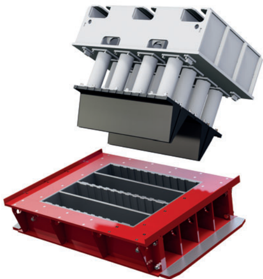
Molde de bloque de hormigón para bordillos altos