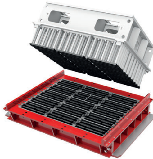
Molde de bloque de hormigón para bloques huecos