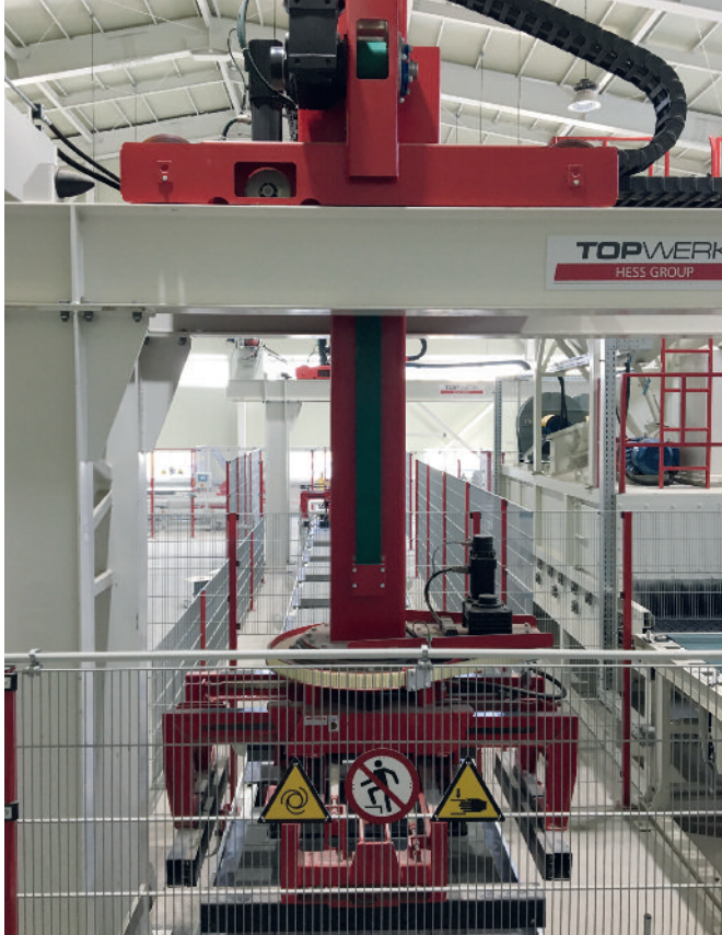
Chwytki serwo firmy Topwerk.