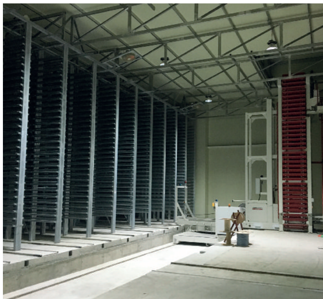
Komora dojrzewania została wyposażona przez firmę Rotho.

Podsumowując, wysokiej klasy maszyna o niezawodnych parametrach produkcyjnych pozwala firmie Seoho wytwarzać wysokiej jakości wyroby betonowe, doskonale spełniając wszystkie jej wymagania. W zakładzie zamontowano także system mieszania kolorów, który umożliwia produkcję kostki brukowej najróżniejszych wariantach kolorystycznych.