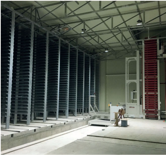
Die Härtekammer wurde von Rotho ausgestattet.

Ölbad-Rüttlern VarioTronic der Topwerk Hess ausgestattet. Das VarioTronic Rüttlersystem in dieser Maschine wird von Servomotoren angetrieben, die elektronisch geregelt werden. Dies führt zu einem extrem zuverlässigen und genauen Verdichtungsprozess für qualitativ hochwertige und homogene Blöcke und Pflastersteine. Die unabhängige Einstellbarkeit von Frequenz und Amplitude gewährleistet eine optimierte Befüllung der Form.