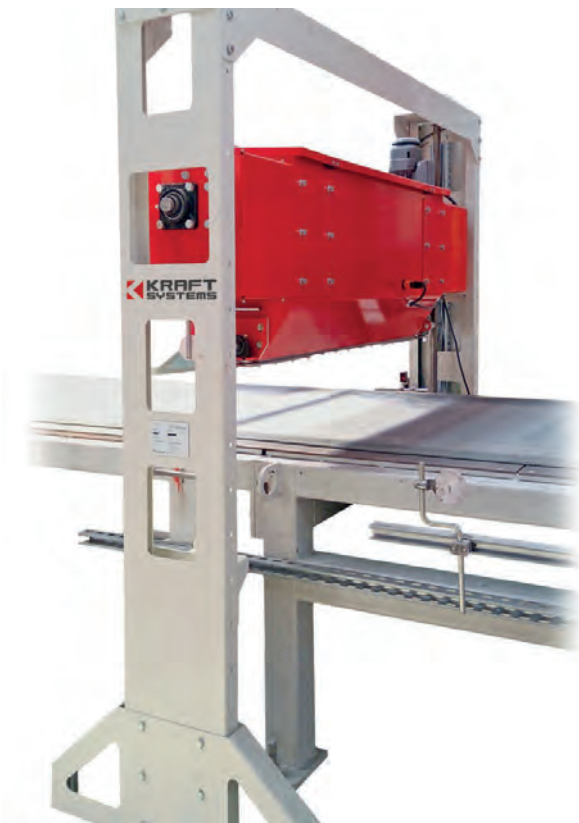
Дозатор гранулята T-Rex фирмы Kraft Systems

Послойное отделение бетонной брусчатки или террасных плит при помощи сетки или флисового полотна зачастую требует много времени и средств, особенно в случае ручной укладки этих материалов. Для решения этой задачи вам на помощь придет дозатор T-Rex компании Kraft Systems, который в полностью автоматическом режиме подает гранулированный пластик для разделения слоев блоков.