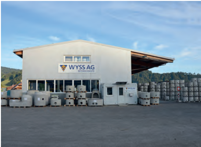
Área de producción y almacenamiento de la empresa Wyss AG Betonschächte en Schüpbach im Emmental, Suiza.

suelos, paredes y muros se introduce en un único paso en los moldes. Así se crean las bases de pozos completas con canales conformados individualmente de una pieza. Los productos se endurecen en el molde y se desencofran por lo general al día siguiente. Como parte de la garantía de calidad, todas las piezas prefabricadas que se elaboran reciben una etiqueta relativa al producto en la que se indican todos los datos relevantes, como fecha de fabricación, dimensiones, peso, representación gráfica de la configuración y, si están disponibles, datos sobre el proyecto y el cliente. El base monolítica fabricada a medida se debe almacenar siempre con precisión hasta su instalación.