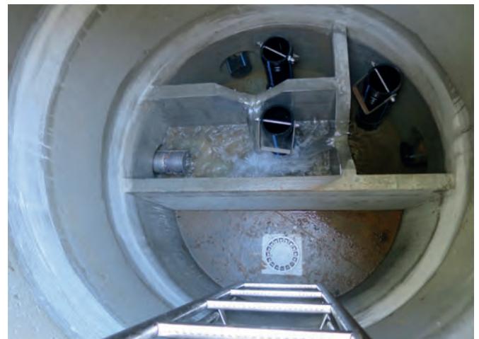
Vista al interior de una arqueta de hormigón a medida fabricada por Wyss AG, de DN1500 y con varias salidas y cuatro cámaras en el lugar de captación de fuente del municipio de Vitznau am Vierwaldstättersee.