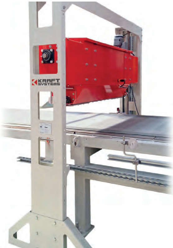
Dosificador de granulados T-Rex de Kraft Systems

La separación por capas de adoquines de hormigón o losas de terraza con materiales como mallas o fieltro es frecuentemente compleja y costosa, sobre todo si estos materiales deben colocarse manualmente. Una solución ideal es el dosificador de granulados T-Rex de Kraft Systems para la separación de capas completamente automática mediante granulados de plástico reciclado.