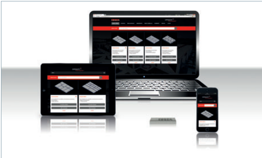
Operate Premiumpartner™ funziona su tutti gli apparecchi mobili