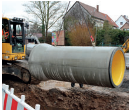
Disposición sobre la zanja con la ayuda de una suspensión de cadena fijada a dos anclajes de cabezal esférico.