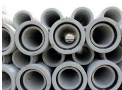
Tubos de hormigón con junta integrada, fabricados siguiendo el procedimiento Perfect Pipe

Tamara Grafe Beton se fundó como empresa familiar en el año 1903. Las experiencias acumuladas con el transcurso de los años y su relación con los materiales, el espíritu emprendedor y la elevada exigencia aplicada a los productos se transmitieron de una generación a la siguiente. El grupo empresarial Grafe Beton se ha convertido en una empresa mediana reconocida en Sajonia y en un socio solicitado en diversos sectores gracias a sus innovaciones consecuentes, a su creatividad y a la garantía de gran calidad en la producción y el servicio. Prueba de ello son la confianza de los clientes y sus distintos galardones.