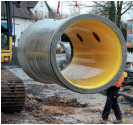
Levantamiento de un tubo Perfect Pipe listo para su instalación con dos aperturas laterales.

mente rocosa del terreno y a los daños materiales, esto resulta en un mayor reconocimiento por el rápido progreso de la instalación del sistema Perfect Pipe. También los trabajadores en el lugar de obra están entusiasmados con la calidad y el sencillo y meditado manejo de los tubos. El sistema demuestra sus ventajas en especial con la unión de tubos mediante los característicos conectores Perfect, conexiones de enchufe de plástico instaladas de fábrica con juntas labiales abatibles en ambos lados, tal y como confirma Ingolf Schäfer, capataz de la empresa Bauer GmbH: «Las conexiones preinstaladas en el lado del manguito de campana nos permiten establecer con facilidad una unión de tubos estanca. La anticorrosión continua del tramo queda asegurada al unir dos tubos con el conector Perfect».