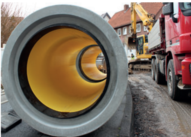
Almacenamiento intermedio de los tubos de hormigón armado Perfect Pipe de DN1000 Perfect Pipe con conexiones de enchufe de plástico en la obra de Sandershausen, municipio de Niestetal.

nua. El tramo tiene una longitud total de 300 m y se ejecuta en construcción abierta. Junto a tubos con una longitud de 3 m cada uno se emplean tubos distanciados más cortos, también con revestimiento de HDPE, así como un total de seis bases de pozos Perfect fabricadas por Tamara Grafe Beton. Además de por el incremento en su capacidad de carga de agua, el nuevo tramo de canal se caracteriza fundamentalmente por una mayor resistencia frente a la corrosión, la cual va acompañada de una capacidad de carga estática superior. Aunque retirar los antiguos tubos que debían sanearse presentaba una gran dificultad debido a la composición parcial-