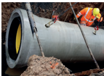
Vorsichtiges Absetzen des Rohres und Anbindung an den neuen Kanalstrang

Ein besonderes Merkmal von Tamara Grafe Beton ist die ausgesprochen breite Palette von Betonprodukten. Sonderwünsche und anspruchsvolle Aufträge sind eine gern gesehene Herausforderung und geben dem Familienunternehmen generell Anlass für neue Lösungen, Systeme oder Produkte. Produziert wird in vier Betonwerken und zwei Kiesgruben. Die Werke sind jeweils auf bestimmte Produktbereiche spezialisiert. Grafe Beton beliefert Kunden weit über die sächsischen Grenzen hinaus, auch in die Tschechische Republik und nach Polen.