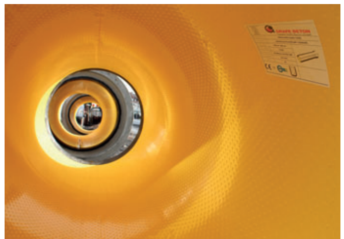
Der innen liegende Perfect Liner aus korrosionsresistentem HDPE zeichnet sich durch seine dauerhafte Beständigkeit gegenüber chemischen Belastungen aus.