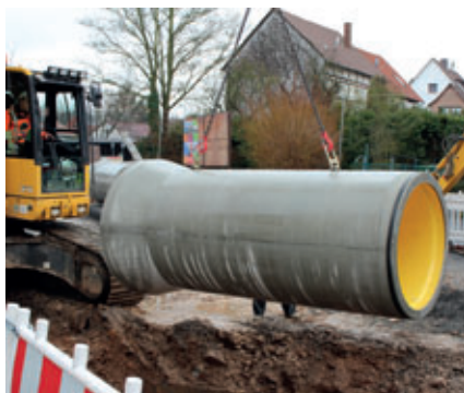
Einheben in die Baugrube unter Zuhilfenahme eines an zwei Kugelkopfantern befestigten Kettengehänges