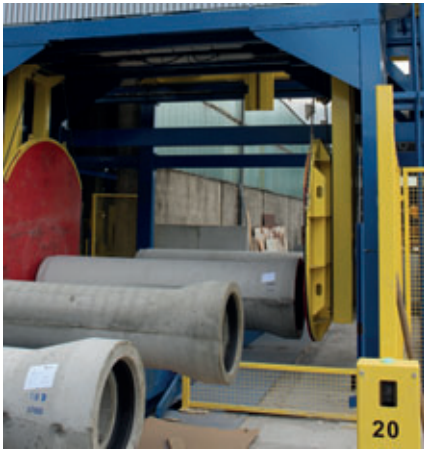
Die Rohre werden prozessimmanent auf Dichtheit überprüft.