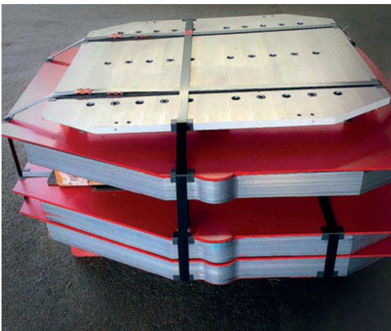
Système de cadre Kobra

Avec le lancement des produits hermétiques, Wasa répond à la demande de ses nombreux clients déjà convaincus par la qualité et le savoir-faire artisanal de l'entreprise dans le domaine de la construction de moules en polyuréthane. Les moules présentent une très haute stabilité et une très haute résistance mécanique,