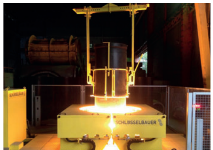
Thermoplastische Umformung der Perfect Liner-Enden für den späteren Sitz des Connectors