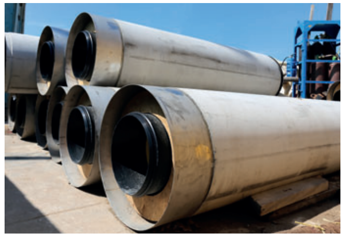
Zwischenlager von Perfect Pipe-Vortriebsrohren an der Baustelle