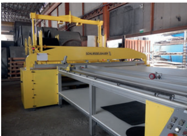
Ablängen und vollautomatisches Schweißen der Perfect Liner-Folie entsprechend dem gewünschten Rohrdurchmesser