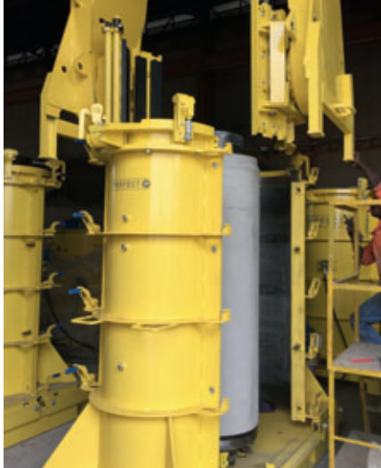
Entschalen eines ausgehärteten Vortriebsrohres