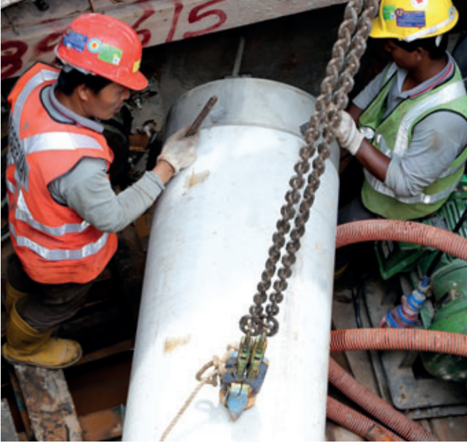
Einheben eines Rohres in den Startschacht