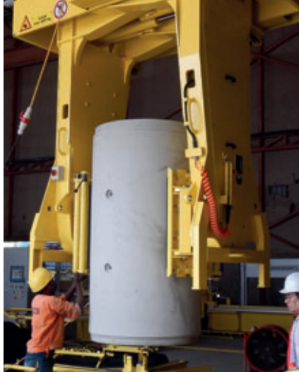
Sicheres Arbeiten mithilfe des Produktgreifers

nen, herkömmliche Betonrohre mit widerstandsfähigen Kunststoff-Linern auszukleiden, um den Korrosionsschutz und die Lebensdauer von Abwassersystemen im Allgemeinen zu verbessern. In der Vergangenheit waren es noch häufig keramische, vergleichsweise spröde Rohre, die bei Kanalisationssystemen in Singapur zum Einsatz kamen. Aufgrund verstärkter Bauaktivitäten und damit verbundenen Bodenbewegungen geht der Trend nun eindeutig zu robusten Beton-Kunststoff-Verbundrohren, die sich durch eine hohe Widerstandsfähigkeit gegen alle Arten von chemischen Angriffen auszeichnen.