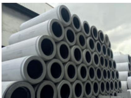
Lager von Perfect Pipe-Vortriebsrohren im Bilcon-Hauptwerk in Singapur

Derzeit werden am Standort in Singapur Perfect Pipe-Vortriebsrohre der Nennweiten