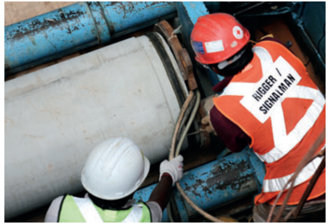
Vorbereitung der Vortriebstechnik