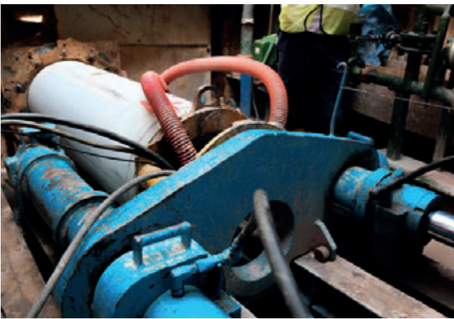
Zuverlässiges Einpressen des Rohres