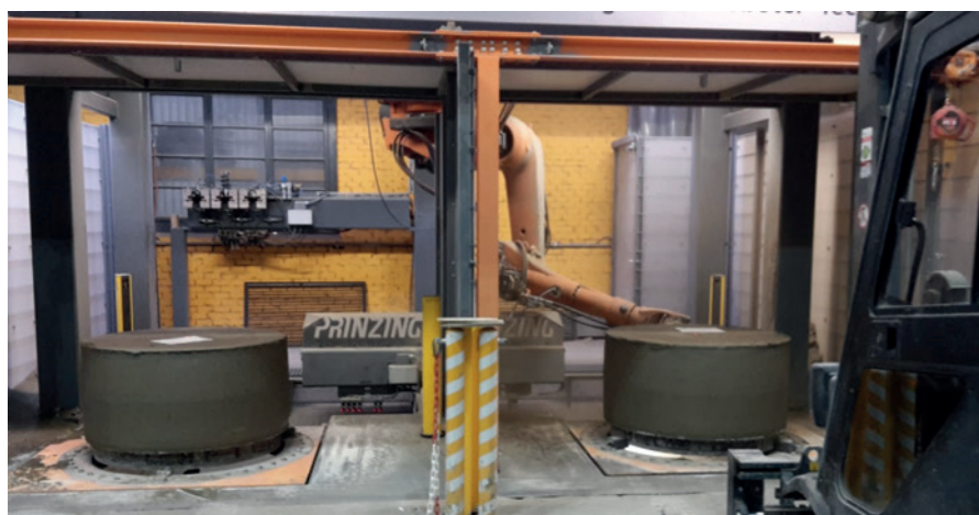
Двойная фрезерная станция с 2 роботами (один робот установлен на уровне пола, второй – в приямок)

После монтажа соответствующих уплотнителей монолитное кольцо с днищем готово к эксплуатации. Также возможны дополнительные опции – просверливание отверстий для маршевых подъемных скоб или фрезеровка выступа в водоводе.