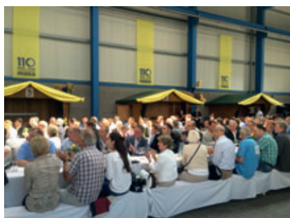
... davanti a circa 300 ospiti provenienti da tutte le parti della terra.