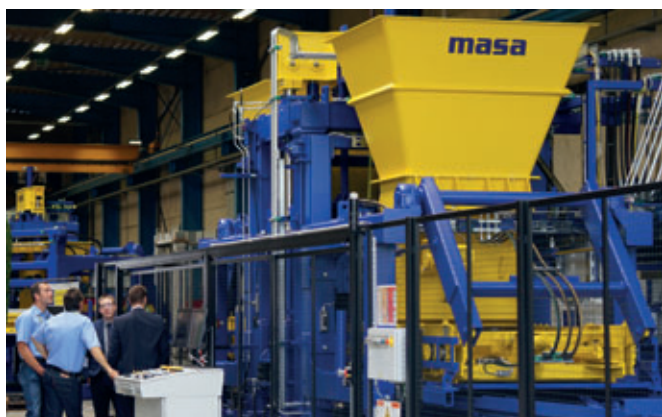
Un punto di attrazione particolare è stato quello delle presentazioni delle macchine: oltre alla blocchiera Masa XL 9.2, ...

Con orgoglio la società ha presentato anche il giardino di esposizione dei campioni di pietre ultimato giusto in tempo per festeggiare i 110 anni. I visitatori della Masa hanno avuto l'occasione di ammirare, in un'atmosfera rilassata, la varietà di blocchi con forme, colori e superfici di vario genere, blocchi che ovviamente sono