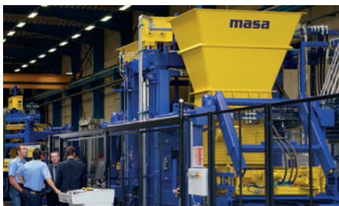
Les démonstrations de machines ont été des événements marquants – la machine de production de blocs de béton Masa XL 9.2, ...

C'est également avec fierté que l'entreprise a fait découvrir son jardin d'exposition, terminé juste à temps pour fêter les 110 ans. Dans cette atmosphère détendue, les visiteurs ont pu admirer la grande diversité des blocs de béton exposés dans toutes les formes, les couleurs et les structures de surface - des blocs de béton tout naturellement