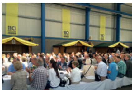
... devant environ 300 invités venus du monde entier.