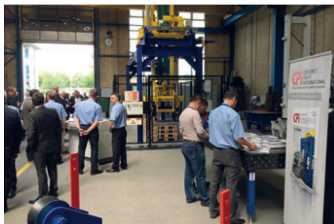
... también se presentó en directo el rendimiento de la máquina Masa Cuboter