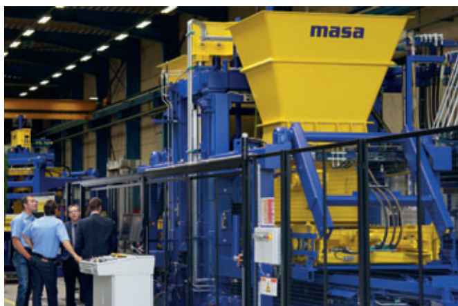
Un punto de atracción especial fueron las demostraciones de las máquinas: además de la máquina bloquera Masa XL 9.2, ...

La empresa también presentó con orgullo el jardín de bloques de muestra, que se terminó justo para la celebración de los 110 años. A partir de ahora, los visitantes de Masa podrán apreciar dentro de un