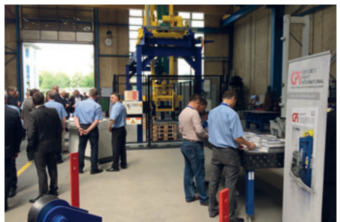
... wurde auch die Leistungsfähigkeit des Masa Cuboters live demonstriert.