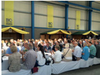
... vor den rund 300 Gäste aus allen Teilen der Welt