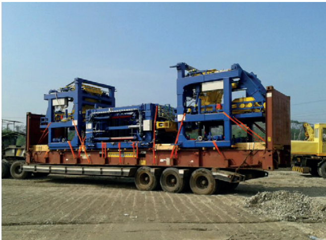
Доставка камнеформовочной машины Masa XL 9.1