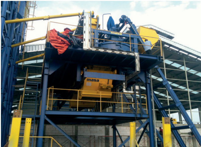
Смесители Masa PH 1500/2250 и система адресной подачи бетонной смеси