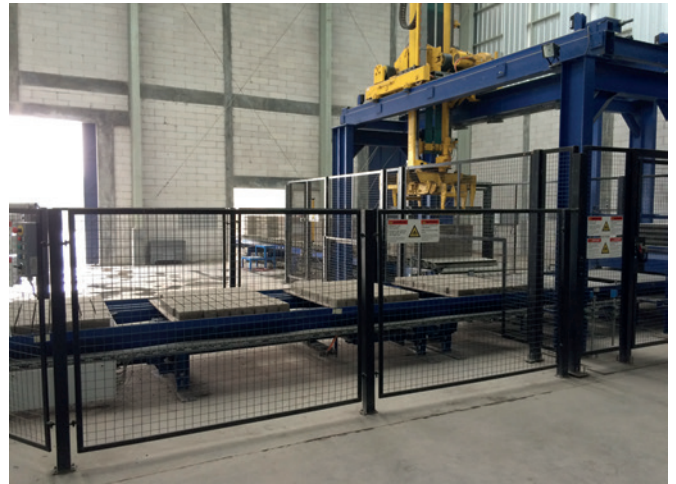
Станция кубирования Masa Cuborter

пакеты проходят горизонтальную и вертикальную обвязку и вывозятся на внешний склад с помощью вилочного погрузчика.