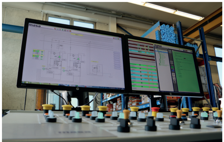
Система управления и визуализации Masa FAST на линии XL 9.1

которые на скиповых подъемниках доставляются в смесители для лицевого и опорного бетона. БСУ состоит из двух горизонтальных смесителей Masa принудительного действия серии PH. Опорный бетон приготавливают в смесителе PH 1500/2250 объемом 2250 л сухих материалов, а для приготовления лицевого бетона используется модель Masa PH 500/750 объемом 750 л.