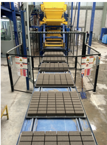
Свежеотформованные блоки покидают машину XL 9.1