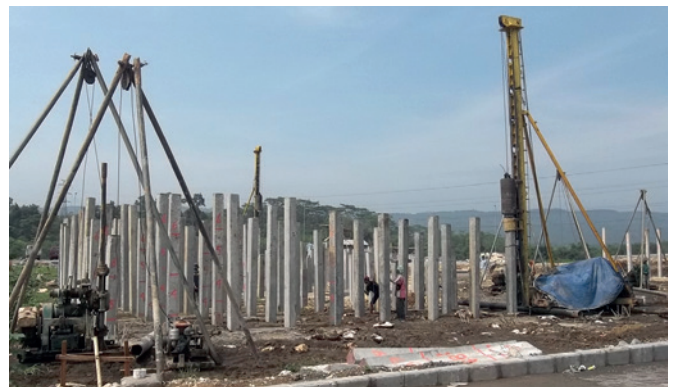
Укрепление грунта путем забивки бетонных свай