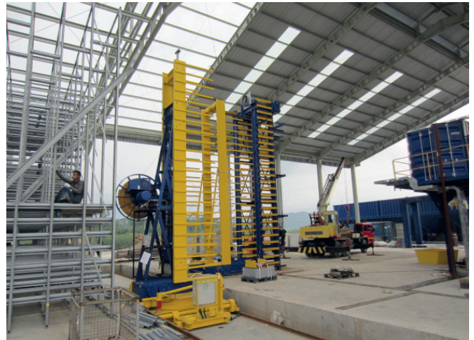
Монтаж стеллажей для камеры тепловлажностной обработки