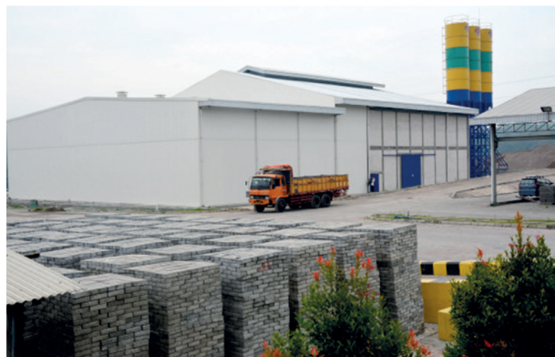
Новый завод примерно в 100 км к югу-востоку от Джакарты