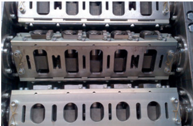
Fig. 3: La probada tecnología de enderezado multi-rotor brinda una calidad de enderezado perfecta.