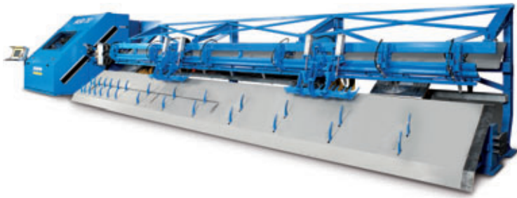
Fig. 1: La MSR20 2BK endereza, corta y dobla acero de armadura de bobinas con un diámetro de hasta 20 mm.

Con la puesta en marcha de una nueva instalación enderezadora, curvadora y de corte modelo MSR20 2BK, OneSteel Reinforcing, la mayor empresa de procesamiento de acero de Australia, entra en una nueva era de la precisión de enderezado. Esta es la segunda instalación que progress Maschinen & Automation, una empresa del Progress Group, entrega a OneSteel.