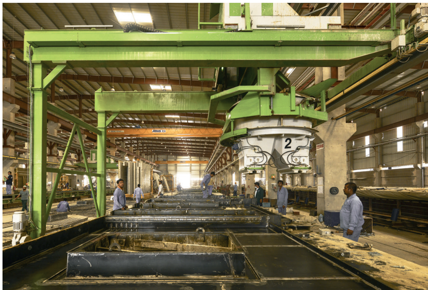
Заливочная машина на заводе Alrashid Abetong

«В нашем деле очень важно понимать и выполнять требования клиентов, а также выбирать проекты, которые экономят ресурсы и позволяют максимально полно использовать производственные мощности», – поясняет Микаэл