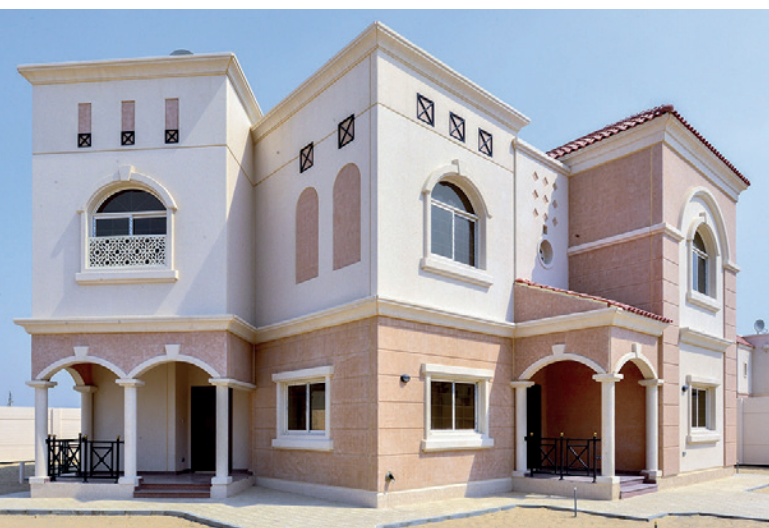
Проект Ma'aden по строительству вилл в Эль-Джубайле

мы подыскиваем надежных партнеров. Компания Elematic входит в их число», – объясняет Микаэл Карлссон.