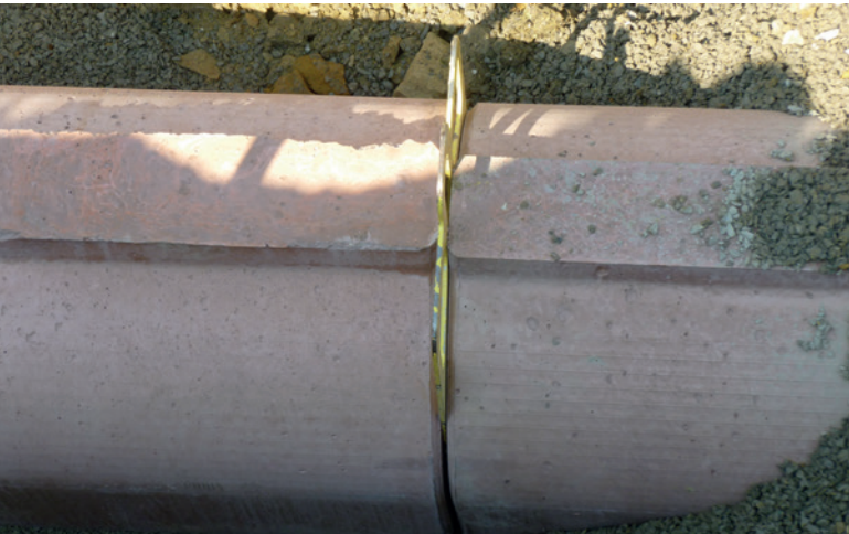
Простые позиционирующие устройства извлекаются после соединения труб