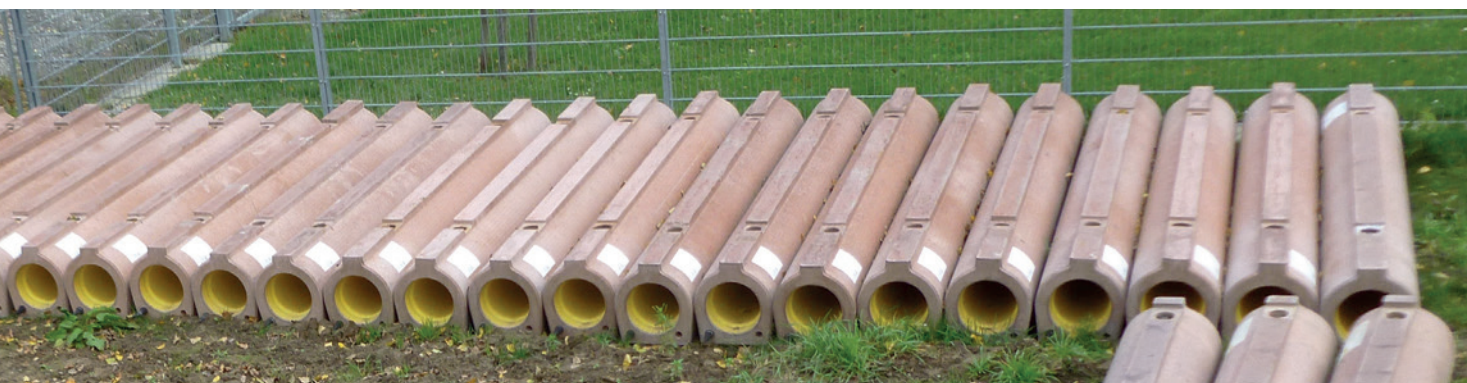
Склад труб Perfect Pipe внутренним диаметром DN250 в Эндингене (Кайзерштуль)

Крепкие бетонные или железобетонные трубы сами по себе отличаются большим весом на погонный метр, чем трубы, изготовленные из других материалов. Как следствие, в случае с трубой Perfect Pipe с плоской подошвой, большое внимание уделяется технике безопасности при производстве, транспортировке и укладке. На заводе, как правило, после приклеивания облицовки HDPE почти все производственные этапы выполняются в полностью автоматическом режиме, так что на рабочих возложены задачи контроля и несложные ручные процедуры. Например, за один проход в форме вручную устанавливаются подъемные анкеры. После затвердения