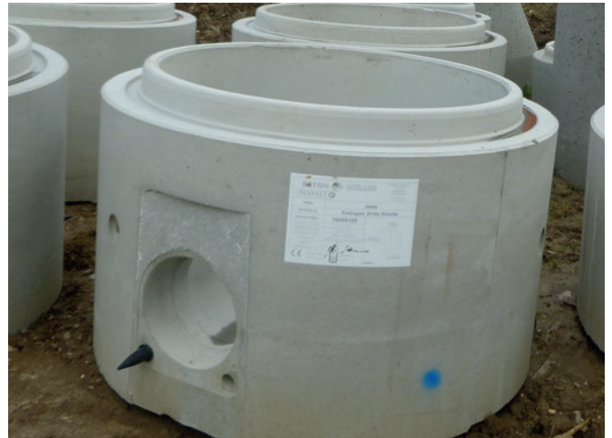
Коннекторы и болты, работающие на срезающую нагрузку, позволяют без проблем выполнять соединения между трубой и колодцем