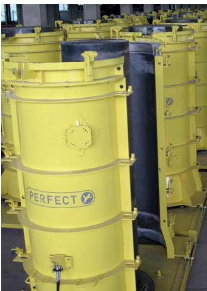
Формооснастка для серийного производства бетонных труб по технологии твердения в опалубке

Schlüsselbauer Technology GmbH & Co KG Hörbach 4 4673 Gaspoltschhofen, Austria T +43 7735 71440 F +43 7735 714456 sbm@sbm.at , www.sbm.at www.perfectsystem.eu