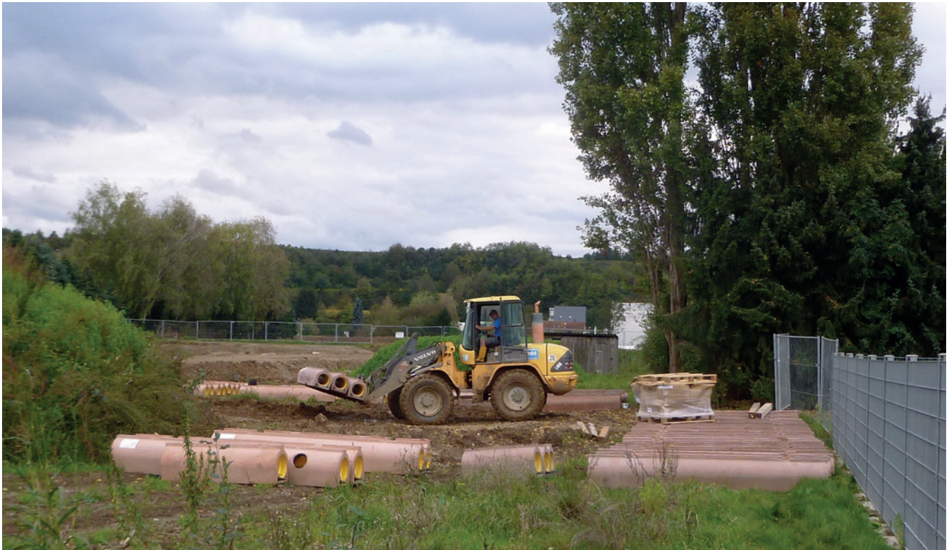
Для перемещения труб на стройплощадке не требуется сложных приспособлений

труб эти анкеры оказываются прочно замоноличенными в бетон и служат для безопасной выгрузки на стройплощадке и контролируемого спуска в траншею. Геометрия трубы с плоской подошвой упрощает как транспортировку, так и хранение на стройплощадке. Трубы