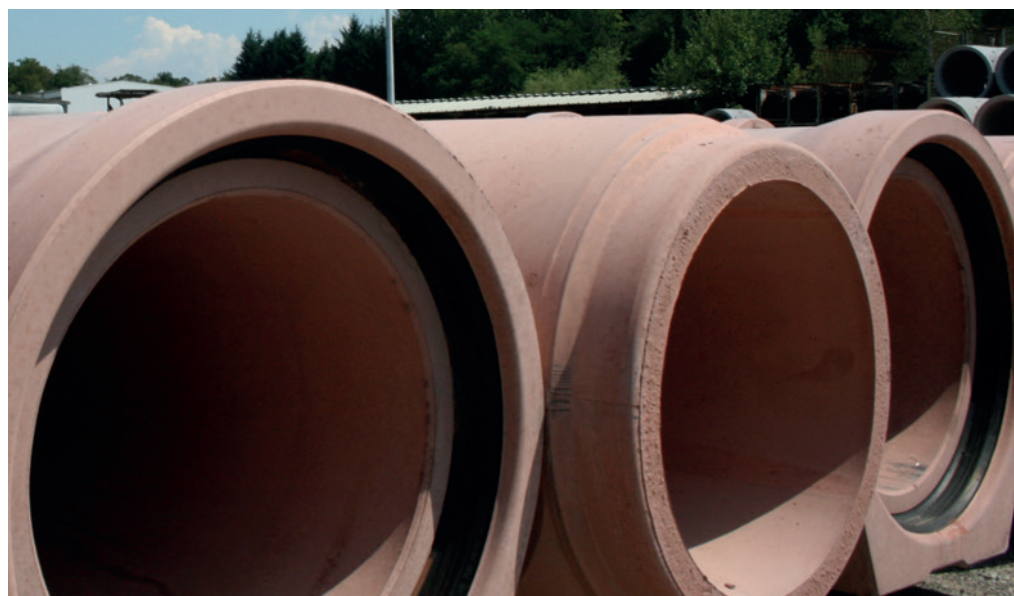
Бетонные трубы с плоской подошвой номинальным диаметром до DN1200 поставляются с любым сечением (в зависимости от номинального внутреннего диаметра)