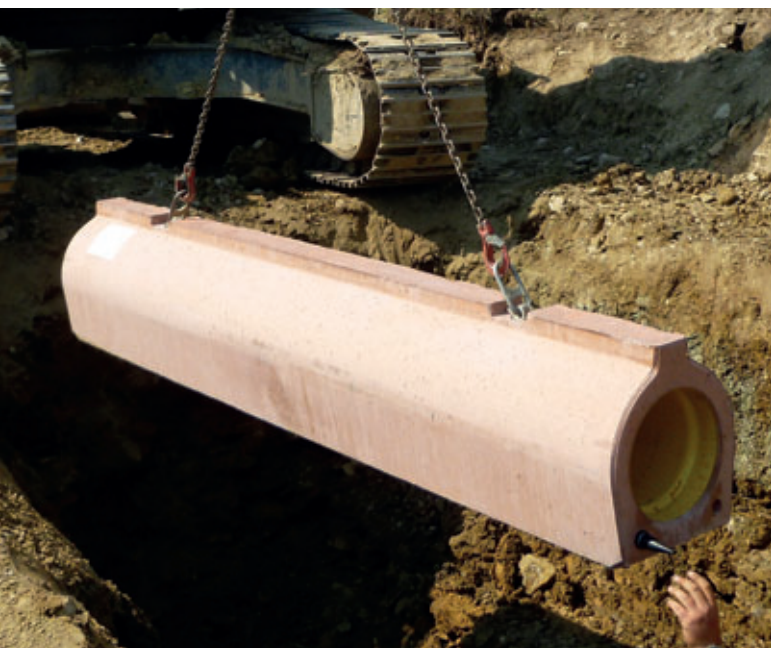
Einheben der Rohre mit fest im Beton eingebundenen Hebeankern

tisch ausgeführt, sodass die Arbeiter lediglich mit Kontrollaufgaben und leichten manuellen Tätigkeiten befasst sind. In einem Arbeitsgang werden beispielsweise Hebe-Anker manuell in den Betongießformen fixiert. Diese Anker sind nach dem Aushärten der Rohre fest im Beton eingebettet und stellen eine Grundlage für das sichere Abladen auf der Baustelle und kontrolliertes Einheben der Rohre in den Graben dar. Sowohl der Transport als auch die Lagerung auf der Baustelle werden durch die Fußrohrgeometrie erleichtert. Die Rohre sind stabil lagerbar. Auch beim Verlegen der Rohre wird auf die Sicherheit der Arbeiter geachtet. Ein Positionierwerkzeug zeigt dem Arbeiter einerseits den idealen Sitz des Connectors beim Zusammensetzen der Rohre an, andererseits kann er damit das Rohr ideal führen und gleichzeitig seine Hände schützen. Der Umstand, dass mit neuen Fertigungsverfahren die Hersteller von Betonrohren gezielte Maßnahmen zur Erhöhung der Arbeitssicherheit für alle im Produktions- und Einbau-Prozess Mitwirkenden setzen, wird von Auftraggebern und Baufirmen gleichermaßen geschätzt.