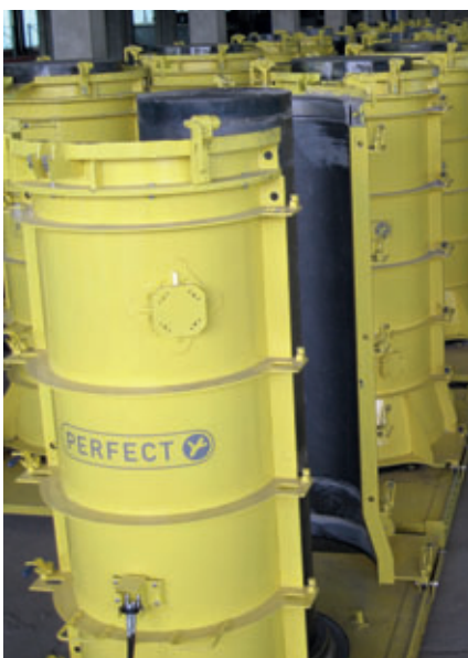
Ausstattung zur Serienfertigung schalungserhärteter Betonrohre

Schlüsselbauer Technology GmbH & Co KG Hörbach 4 4673 Gaspoltschhofen, Österreich T +43 7735 71440 F +43 7735 714456 sbm@sbm.at , www.sbm.at www.perfectsystem.eu