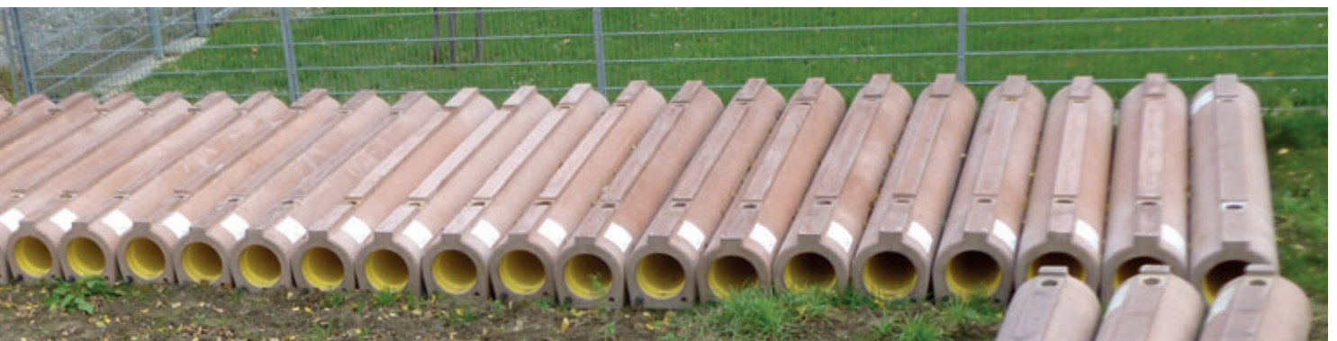
Typisches Baustellenlager Perfect Pipe DN250 in Eendingen am Kaiserstuhl

Robuste Beton- oder Stahlbetonrohre haben per se ein höheres Laufmetergewicht als andere Rohrmaterialien. Insbesondere bei dem als Fußrohr konzipierten Perfect Pipe wird daher auf Arbeitssicherheit bei der Herstellung, dem Transport und dem Einbau der Rohre großer Wert gelegt. So werden im Produktionswerk üblicherweise nach der Konfektionierung der HDPE-Liner nahezu alle Fertigungsschritte vollautomatisch