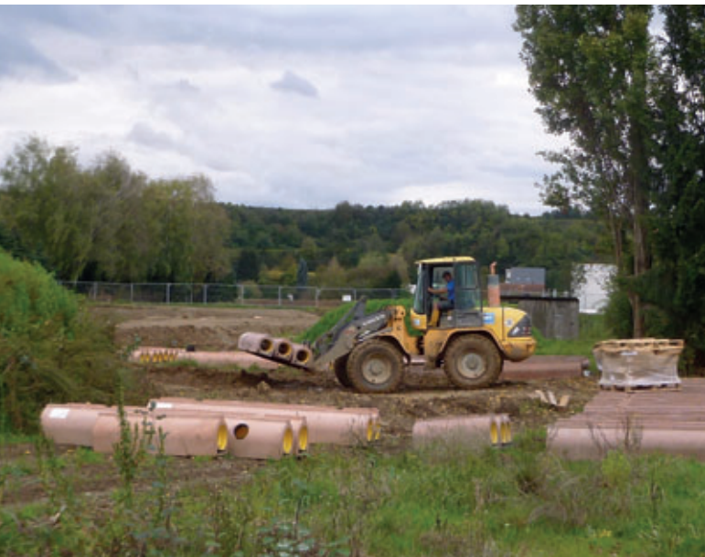
Mit einfachem Gerät werden die Rohre auf der Baustelle bewegt.

tisch ausgeführt, sodass die Arbeiter lediglich mit Kontrollaufgaben und leichten manuellen Tätigkeiten befasst sind. In einem Arbeitsgang werden beispielsweise Hebe-Anker manuell in den Betongießformen fixiert. Diese Anker sind nach dem Aushärten der Rohre fest im Beton eingebettet und stellen eine Grundlage für das sichere Abladen auf der Baustelle und kontrolliertes Einheben der Rohre in den Graben dar. Sowohl der Transport als auch die Lagerung auf der Baustelle werden durch die Fußrohrgeometrie erleichtert. Die Rohre sind stabil lagerbar. Auch beim Verlegen der Rohre wird auf die Sicherheit der Arbeiter geachtet. Ein Positionierwerkzeug zeigt dem Arbeiter einerseits den idealen Sitz des Connectors beim Zusammensetzen der Rohre an, andererseits kann er damit das Rohr ideal führen und gleichzeitig seine Hände schützen. Der Umstand, dass mit neuen Fertigungsverfahren die Hersteller von Betonrohren gezielte Maßnahmen zur Erhöhung der Arbeitssicherheit für alle im Produktions- und Einbau-Prozess Mitwirkenden setzen, wird von Auftraggebern und Baufirmen gleichermaßen geschätzt.