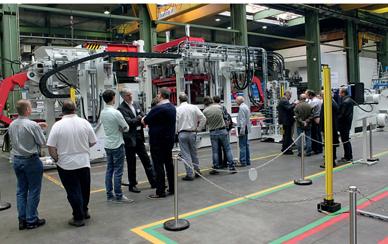
Большой интерес вызвала установка RH 1500-3 MVA

Компания SR-Schindler из Регенсбурга продемонстрировала комплектную линию по облагораживанию блоков и соответствующие образцы камней.