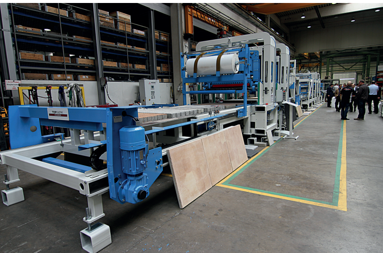
Компания SR-Schindler из Регенсбурга продемонстрировала комплектную линию по облагораживанию блоков и соответствующие образцы камней