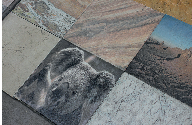
Помимо вышеупомянутого цветного оттиска медведя коала гости смогли полюбоваться большим разнообразием возможностей облагораживания