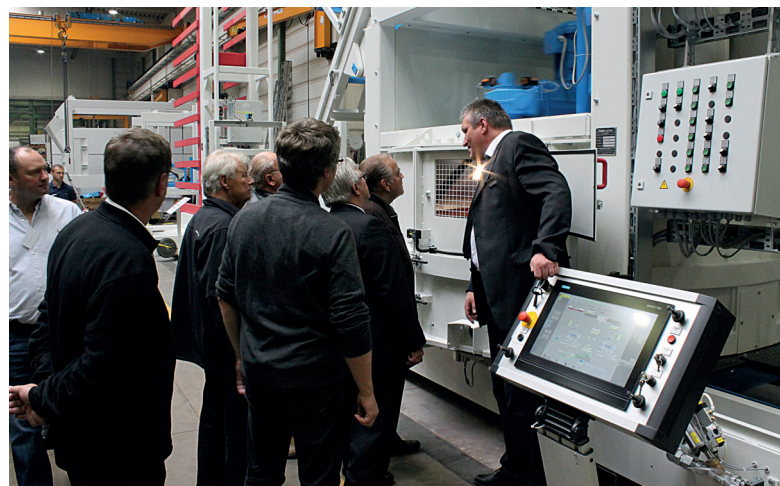
Презентация смесителя серии SM