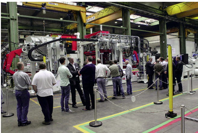
Wibroprasa RH 1500-3 MVA wzbudziła duże zainteresowanie.

Dużym zainteresowaniem cieszyła się też oferta firmy Prinzing-Pfeiffer, która specjalizuje