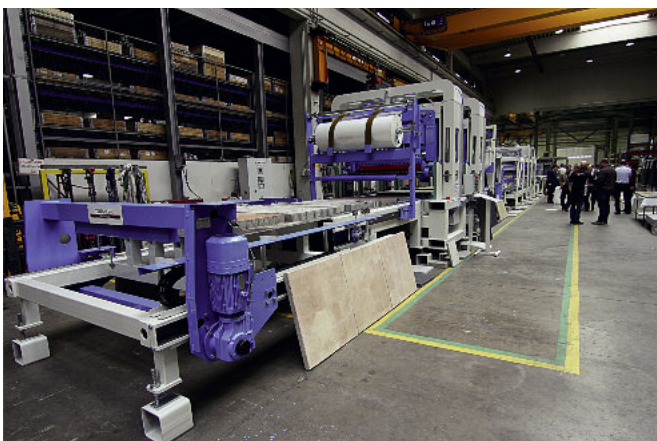
Firma SR-Schindler z siedzibą w Ratyźbonie zaprezentowała kompletną linię uszlachetniania wraz z elementami pokazowymi.