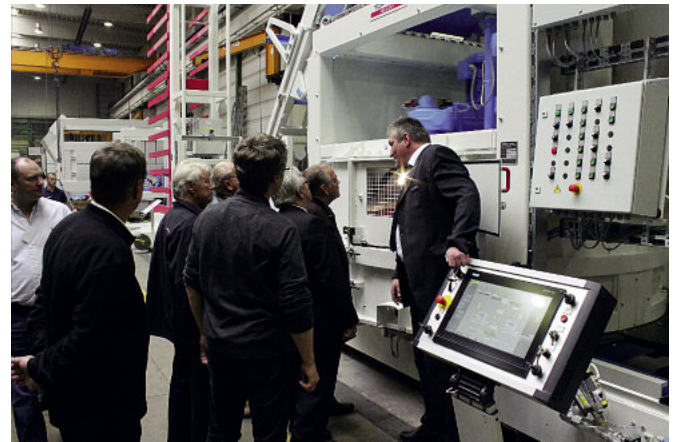
Prezentacja mieszarki z serii SM.