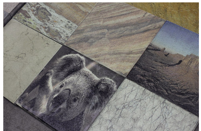
Obok kolorowego nadruku misia koala zwiedzający mogli podziwiać pełną gamę możliwości w zakresie uszlachetniania.