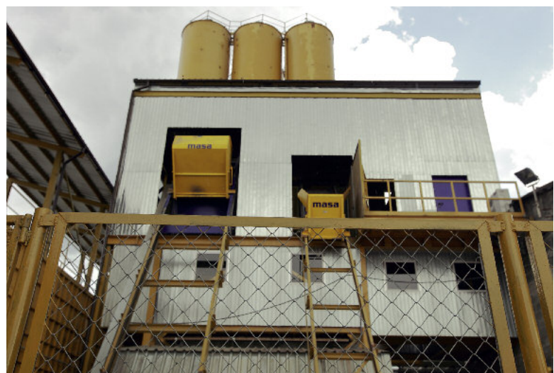
1, 2. Nowy węzeł betoniarski Masa jest wyposażony w dwie mieszarki – S350/500 i PH 1500/2250.