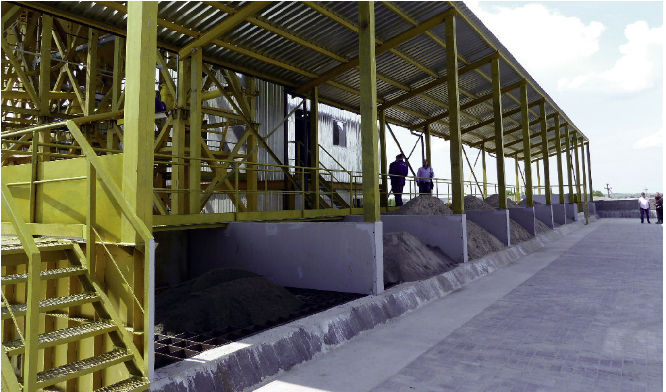
4. Zasobniki firmy Magik Ltd.