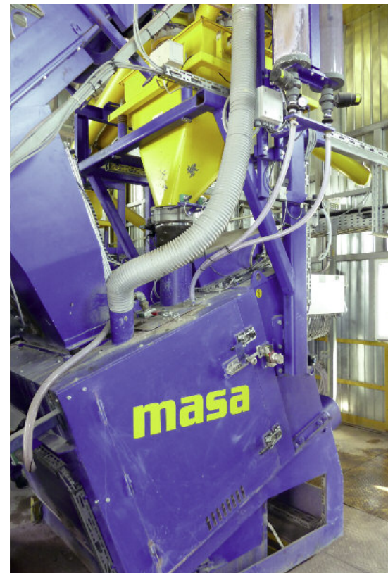
3. Nowa mieszarka Masa S350/500 w zakładzie firmy Magik Ltd. na Ukrainie.

Montaż wykonywany przez pracowników firmy Masa na terenie zakładu firmy Magik Ltd. przebiegł bez problemu, więc prace zakończono terminowo. Nowy węzeł betoniarski był gotowy do pracy w uzgodnionym terminie, a ukraińskie przedsiębiorstwo uczyniło kolejny ważny krok naprzód w swoim rozwoju.