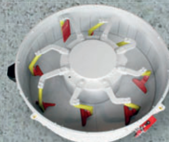
Mescolatore a turbina fino a 3,5 m 3 di calcestruzzo reso vibrato