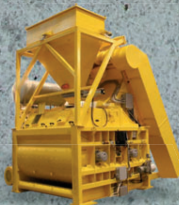
Vasta gamma di accessori