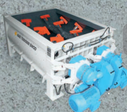
Mescolatore a doppio asse fino a 8m 3 di calcestruzzo reso vibrato