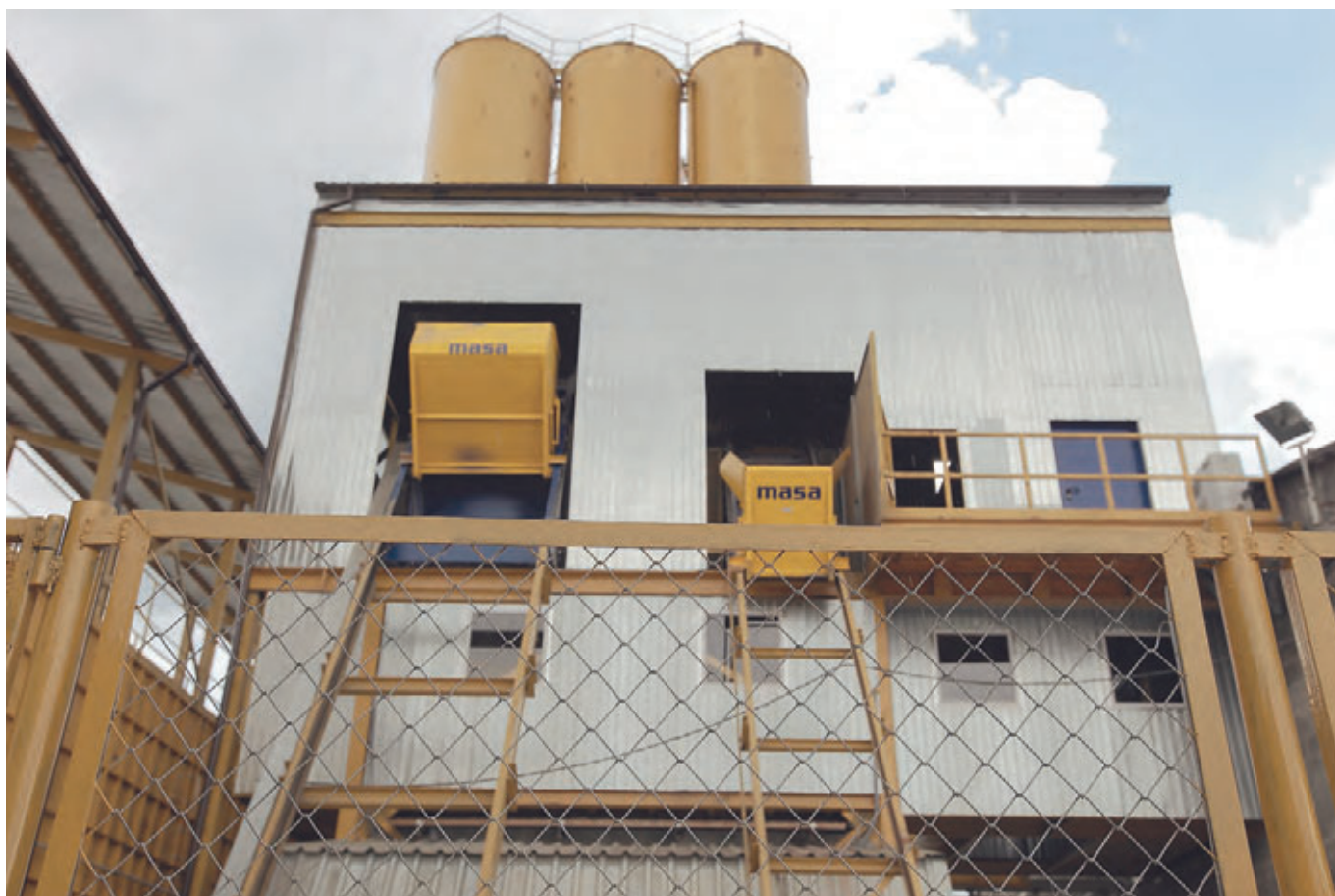
Скипы для двух смесителей S350/500 и PH1500/2250 БСУ Masa