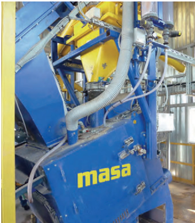
Смеситель Masa S350/500 на заводе ООО «Магик» на Украине

ную установку для производства высококачественной бетонной тротуарной плитки. Для реализации будущих проектов нам нужен эффективный и надежный партнер. Мы очень рады обрести такого партнера в лице компании Masa».