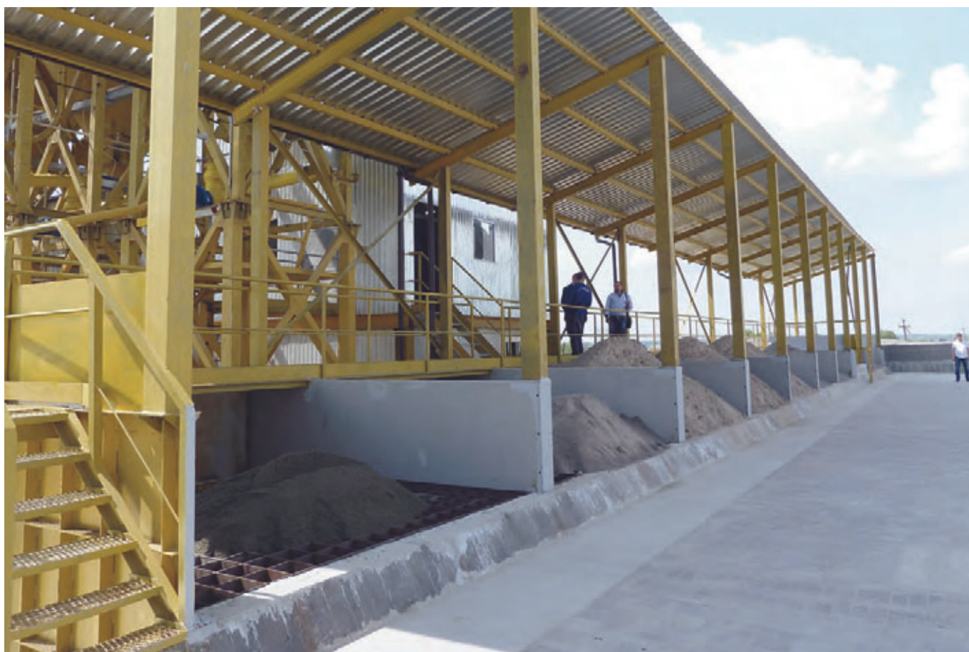
Бункеры для хранения инертных на заводе ООО «Магик»