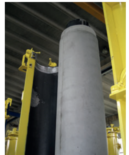
Los tubos de hormigón de colada se fabrican con hormigón fluido y, en consecuencia, con unas tolerancias extremadamente reducidas