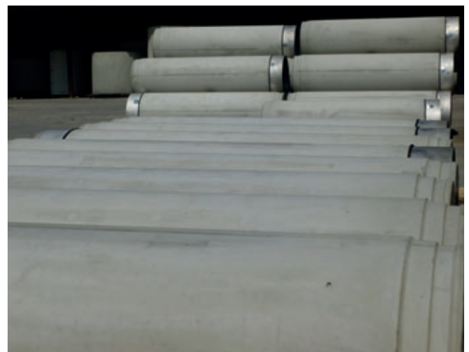
En Stölpchen se producen desde 2014 tubos para hincado Perfect Pipe