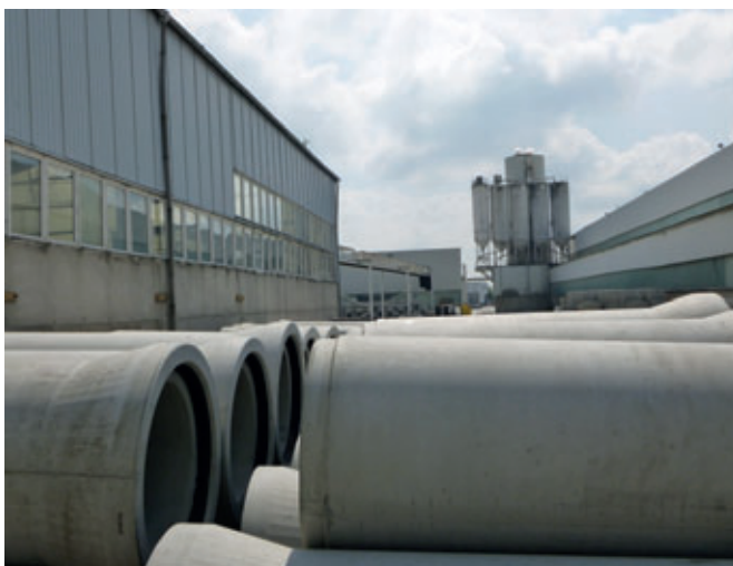
Uno de los cuatro establecimientos de Tamara Grafe Beton GmbH: la planta de Stölpchen

en áreas de captación de agua. Naturalmente, durante las medidas de perforación la unión de los tubos queda protegida de forma adicional por el anillo externo de guía que se encuentra igualmente estancado frente al siguiente tubo. La transmisión de la presión en la instalación tiene lugar a través de los anillos habituales con un grosor especificado. Por supuesto, también es posible utilizar sistemas de transmisión de presión controlables para tubos de perforación de hormigón. Con los tubos de perforación Perfect Pipe se ofrece por primera vez un sistema de tubos de hormigón revestidos para diámetros no transitables de DN300 a DN1200. Se suprimen las laboriosas operaciones posteriores al prensado, tales como la soldadura del revestimiento por medio de robots. Una vez que se haya alcanzado el foso de destino y retirado los conductos necesarios para el hincado, el tramo de tuberías estará listo para el uso.