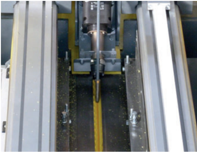
El liner de HDPE se suelda para formar un revestimiento interior estanco para el tubo