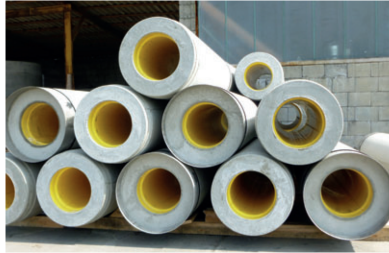
Los tubos de hincado de hormigón Perfect Pipe equipados con un liner de HDPE están disponibles a partir de DN300

Originalmente, la producción de tubos de perforación no fue un objetivo prioritario de Grafe Beton. Solo en la fase final de la elaboración del concepto de producción de Perfect Pipes entre Grafe Beton y el proveedor de equipamientos Schlüsselbauer Technology se decidió corresponder desde el principio a la creciente importancia a nivel mundial de este limitado segmento de productos en la construcción de tuberías. La gran mayoría de los tubos fabricados por Grafe Beton se utilizará en la construcción abierta. Pueden ser tubos de hormigón fundido con junta integrada o tubos compuestos de hormigón y plástico con liner de HDPE para el uso en proyectos con medios químicamente más agresivos. Grafe Beton está preparando la posibilidad de reaccionar con rapidez a dos evoluciones diferentes y, en parte, contradictorias del mercado. Por una parte y con creciente frecuencia, y no solo en Alemania, las tuberías de aguas residuales ya no se realizan con tubos convencionales de hormigón u hormigón armado. Por otra parte, el tubo de hormigón, como componente fundido y colado, está viviendo en numerosos merca-