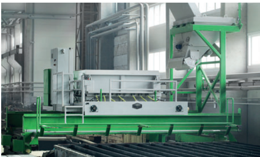
Viele Fertigteile von Lider Prom werden auf Maschinen und Ausrüstung von Elematic hergestellt. Die letzte Neuanschaffung im Werk war eine brandneue Produktionslinie für Fertigteilpfähle.

Lider Prom hat allen Grund, optimistisch in die Zukunft zu blicken. Der Markt für Fertigteile in St. Petersburg und Russland wächst rapide. Darüber hinaus hat das Unternehmen einen Stamm potenzieller Kunden für Stahlbetonfertigteile, einige Testbestellungen liegen bereits vor.