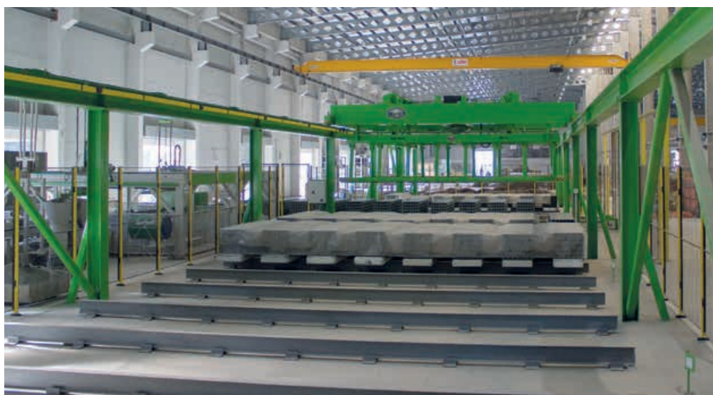
DDT 公司的 Comcaster 铸造机