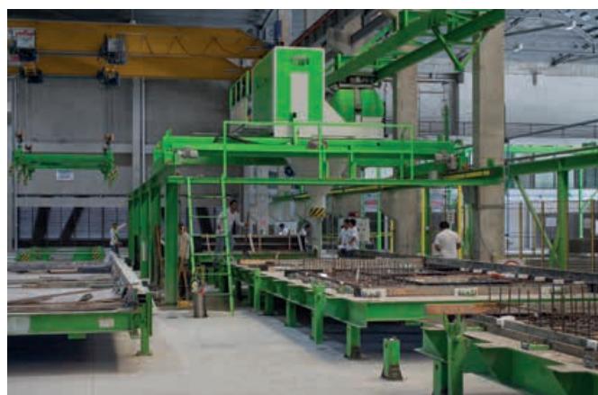
倾斜站的预制外墙板

第二个合同包括一个年产能超过 20 万平方米的 Acotec 墙板生产厂，生产 600 毫米厚、和房间等高的非承重