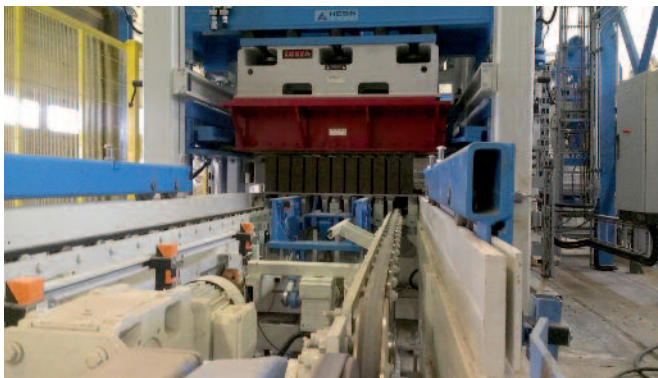
Высокопроизводительная установка Hess RH 1000-2 с электрической тележкой для замены форм

Норвежская компания Weber имеет долгую историю и на протяжении десятилетий специализируется на производстве блоков из бетона марки Leca. С 2007 г. группа компаний Weber входит в состав Saint-Gobain и представлена в 47 странах. В Норвегии компания Weber управляет шестью заводами, на которых занято, в общей сложности, более 300 сотрудников. На фоне растущих требований рынка руководство компании приняло решение о замене камнеформовочной машины и ряда комплектующих циркуляционной системы на заводе в Борге (к югу от Осло).