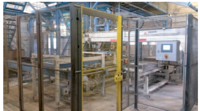
Интеграция накопителя поддонов в существующую линию

Главными критериями при выборе новой установки стали высокая производительность, оптимальное качество в отношении допусков по высоте, прочности и оптических свойств, быстрая замена формоснастки, низкие затраты на опалубку, а также простое техобслуживание и квалифицированный послепродажный сервис. К этому добавилась непростая задача по встраиванию машины в существующую линию.