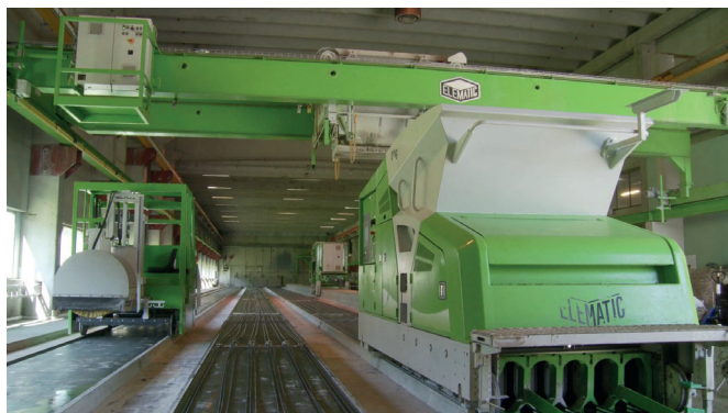
Экструдер E9 на заводе ЖБИ компании Voss

«Сотрудники Elematic проявили высокую степень профессионализма на всех этапах – от монтажа линии до приемки работ. Технические специалисты помогали нам быстро и эффективно разрешать возникающие проблемы», - резюмирует Хьеллстад.