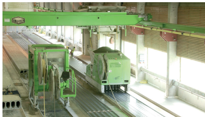
Экструдер в действии